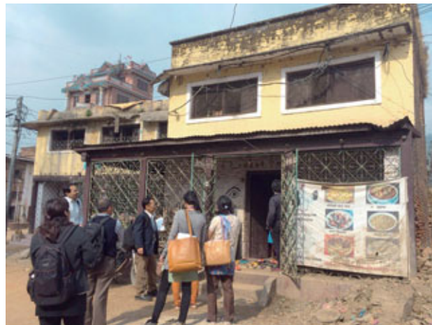
Formation sur le terrain lors du programme de visites d'étude pour les responsables chargés de l'administration de l'éducation (Népal).

des projets de la JICA et des pays en développement. La Global Plaza contribue en outre à la sensibilisation du public en prêtant ses pièces d'exposition aux préfectures de Saitama et Gunma ainsi qu'au Centre préfectoral de Niigata pour l'éducation. Lors d'un cours de formation pour les enseignants nouvellement embauchés dans la préfecture de Saitama, tous les participants ont visité l'exposition.