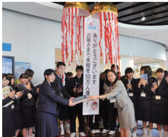
Célébration du 500 000 e visiteurs de la Nagoya Global Plaza.

En décembre 2015, six ans et demi après son ouverture, la Nagoya Global Plaza a dépassé les 500 000 visiteurs. Le même mois, cet événement a été célébré avec les étudiants de première année en communication internationale de l'École supérieure de commerce de la préfecture de Gifu, qui ont visité le site dans le cadre du programme de visites de la Nagoya Global Plaza.