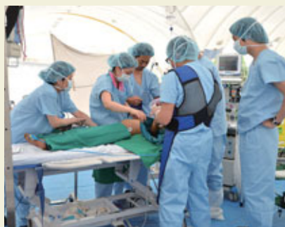
Intervention chirurgicale dans la tente médicale.