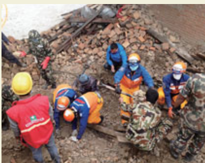
Activités de recherche et de sauvetage.