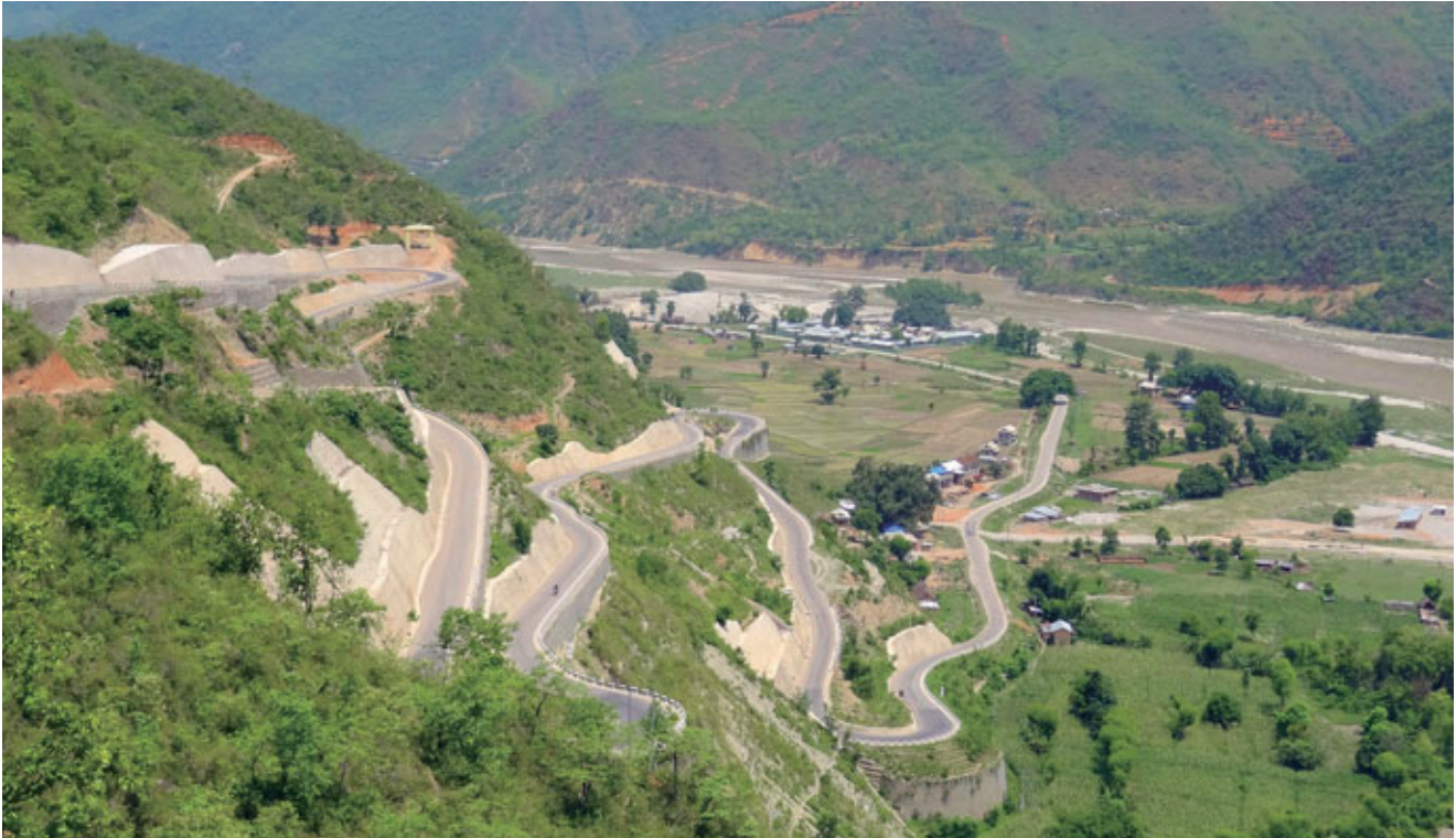
La route de Sindhuili au Népal. La construction a progressé grâce à des dons octroyés à partir de 1995 et elle a été achevée au bout d'une vingtaine d'années. Lors du séisme qui a touché le Népal en 2015, la route est restée praticable et elle est devenue un axe vital pour le transport du matériel de secours.