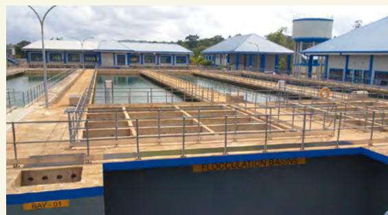
L'usine de traitement des eaux usées de Kandana dans le district de Kalutara, agrandie grâce aux prêts d'APD du Japon.

En intégrant divers instruments d'aide de manière globale et efficace, la JICA continuera de contribuer à l'amélioration de l'environnement pour la croissance durable du Sri Lanka.