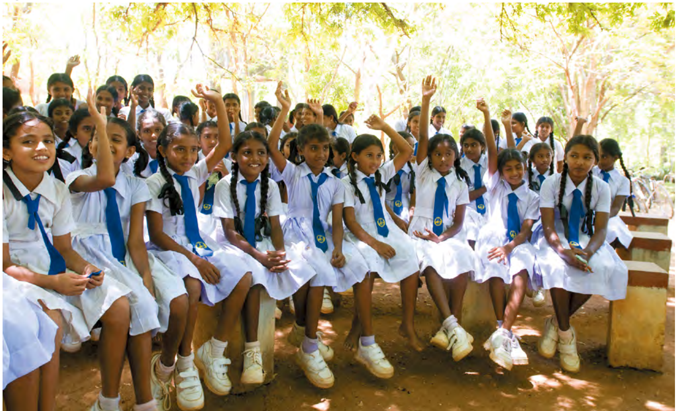
Sri Lanka : Des enfants de producteurs de bananes dans une école d'une zone cible du projet de modernisation et d'extension de l'irrigation.

Vers la croissance économique et la réalisation de sociétés pacifiques et équitables au centre de la région économique de l'océan Indien