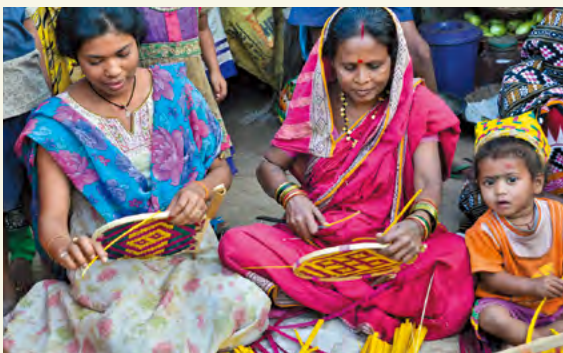
Activité d'amélioration des moyens d'existence dans la phase 1 (fabrication de paniers). Cette aide sera étendue dans la phase 2.

Au cours de la phase 2, afin d'étendre les activités d'amélioration des moyens de subsistance menées par des groupes de femmes, la JICA prévoit d'ajouter des composantes pour améliorer le soutien financier et les débouchés pour les produits. En tant que modèle exceptionnel de protection de la biodiversité et du bien-être humain, un paysage typique japonais (concept de Satoyama) sera adopté dans le cadre du projet. Grâce à ces initiatives, la JICA mettra en œuvre la GCF dans 1 200 villages et visera la mise en culture de 5 700 hectares de terres et une amélioration du revenu des ménages de 15 %. Les résultats obtenus dans l'État d'Odisha devraient dépasser les limites de l'État et s'étendre à l'échelle nationale.