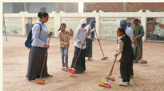
Les élèves d'une école primaire de Gizeh balaient la cours de l'école, car les travaux d'entretien et de gestion des installations scolaires font partie des activités pour apprendre à vivre avec les autres et à travailler en coopération.

Grâce à ces efforts, basés sur les forces du système éducatif japonais, les capacités des jeunes Égyptiens devraient être améliorées afin de contribuer à la stabilisation et au développement, non seulement de l'Égypte, mais de toute la région du Moyen-Orient.