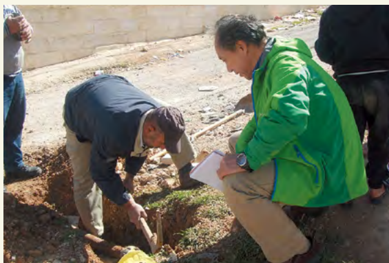
Les responsables de Yarmouk Water Company (YWC) vérifient les fuites des conduites d'eau.

En particulier dans la partie nord du pays, près de la frontière avec la Syrie, alors que les systèmes d'approvisionnement en eau et d'égouts sont détériorés et présentent des fuites et d'autres problèmes, les opérations excédant les capacités de production se poursuivent pour répondre à la demande croissante en eau liée à l'afflux massif de réfugiés, ce qui entraîne une pression importante sur les installations d'eau publiques. Par ailleurs, des tensions ont été observées entre les réfugiés syriens et les résidents jordaniens locaux au sujet de l'eau. C'est pourquoi, en mettant dans un premier temps l'accent sur les services d'approvisionnement en eau et de traitement des eaux usées dans la région du nord, la JICA a participé à la formulation de plans de développement à l'horizon 2035. En outre, la JICA a assuré l'entretien d'urgence et la réparation des installations d'approvisionnement en eau, ainsi que la formation du personnel chargé des travaux de réparation. Les plans de développement ont été salués par le gouvernement jordanien et d'autres donateurs, et divers projets ont été menés conformément aux plans de développement. Ces activités devraient répondre efficacement à la demande en eau dans les régions accueillant des réfugiés et contribuer à la coexistence pacifique entre les communautés d'accueil et les réfugiés.