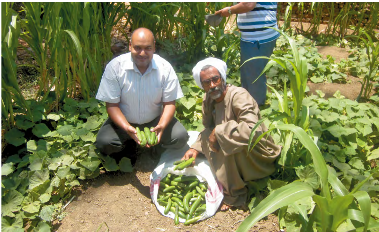
Afin d'améliorer les moyens de subsistance des petits agriculteurs en Égypte, la JICA soutient l'amélioration du rendement et de la qualité des légumes.

Pour la stabilisation par l'aide humanitaire, la reconstruction et le dialogue