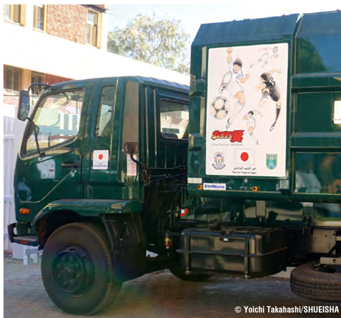
Les véhicules de collecte des déchets fournis au Soudan grâce à un projet de don sont décorés d'autocollants « Olive et Tom » (Captain Tsubasa), un dessin animé japonais, très populaire parmi les enfants et les adultes, diffusé depuis le début des années 1990. Avec la coopération de la JICA, le dessin animé participe à la construction d'un système de collecte des déchets apte à mobiliser la coopération des résidents locaux.