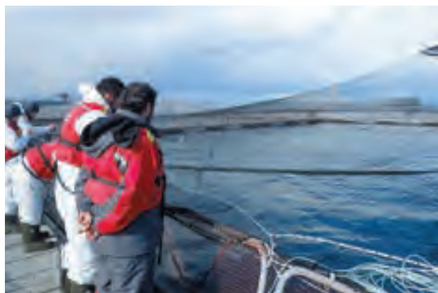
Des chercheurs visitent une ferme salmonicole au Chili. Ils étudient les mécanismes de propagation d'une marée rouge qui ravage les pêcheries côtières et les exploitations aquacoles.

À travers ce dispositif, les propositions de recherche soumises par des instituts de recherche japonais à la JST et l'AMED sont examinées, afin de vérifier si elles correspondent aux demandes des pays en développement (système de correspondance), dans une perspective