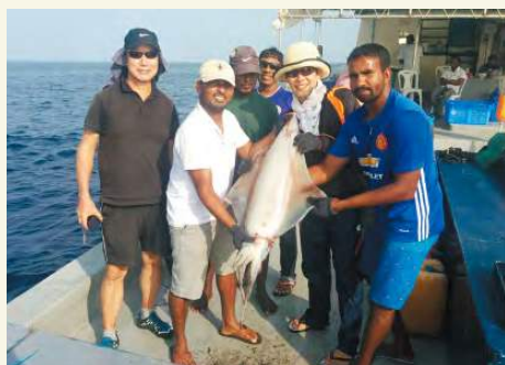
Des responsables des Maldives et des experts de la JICA avec une première prise de calmar chipilou suite à une pêche expérimentale

Les Maldives forment un pays insulaire composé de 1 190 petites îles. Ces dernières années, son économie est devenue très dépendante du secteur du tourisme, pourtant vulnérable à des facteurs externes tels que l'économie mondiale et les pandémies. La pêche est la deuxième industrie des Maldives et elle est essentielle à la sécurité alimentaire nationale, à la création d'emplois dans les communautés rurales de pêcheurs et à l'acquisition de devises étrangères grâce à l'exportation de poisson cru et congelé. Compte tenu de la situation actuelle du secteur de la pêche aux Maldives, notamment sa forte dépendance vis-à-vis de certaines espèces spécifiques comme la bonite et le thon, les Maldives sont contraintes de diversifier l'éventail des espèces pêchées et