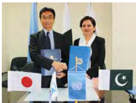
La cérémonie de signature a eu lieu à Islamabad.

Le 5 août à Islamabad, la JICA a signé un accord de don à hauteur de 560 millions de yens avec l'Organisation des Nations unies pour le développement industriel (ONUDI) pour le projet d'aide au développement du secteur