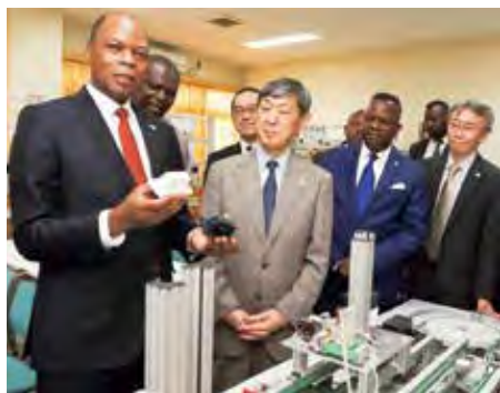
Visite de l'Institut national de la préparation professionnelle

Du 13 au 22 juillet, le président de la JICA, Shinichi Kitaoka, s'est rendu en République démocratique du Congo (RDC) et en République du Rwanda, où il a rencontré des responsables gouvernementaux des deux pays et