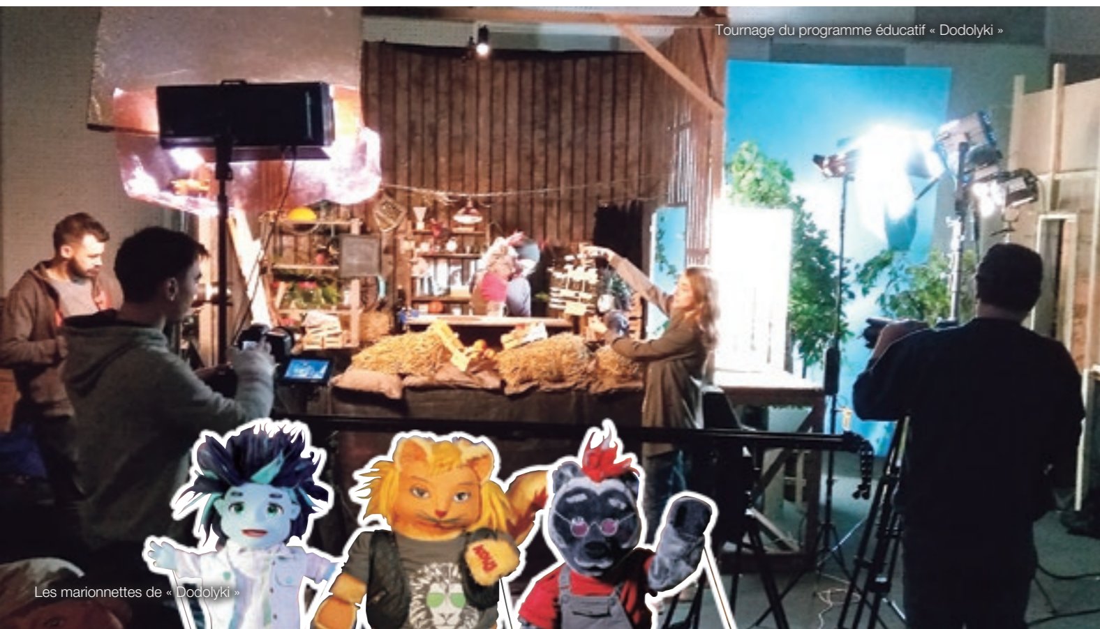
Tournage du programme éducatif « Dodolyki »