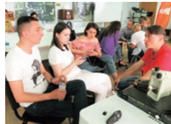
Une discussion animée entre les membres du personnel autour de thèmes tels que la radiodiffusion publique et les alertes d'urgence.