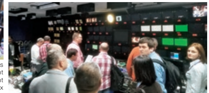
Le personnel de la PBC observe le studio et les équipements de la NHK pendant une formation au Japon.