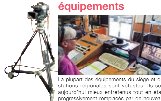
La plupart des équipements du siège et des stations régionales sont vétustes. Ils sont aujourd'hui mieux entretenus tout en étant progressivement remplacés par de nouveaux équipements.