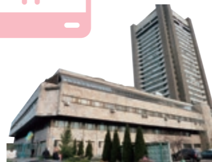
Le siège de la Compagnie nationale publique de diffusion à Kiev