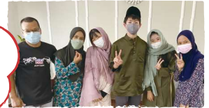
海外研修の様子(マレーシア)

上位入賞者は、 海外研修の参加や フェアトレード商品を贈呈! 応募者全員に参加賞、多数の作品を 応募いただいた学校には学校賞を お贈りします。