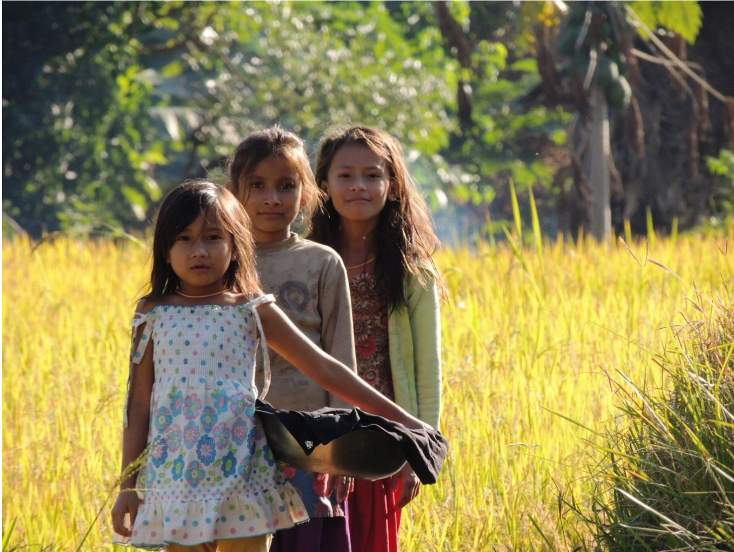
2012年11月 / ネパール・ダディン郡

学校から帰ると、家の仕事があります。わたしたちは、川で洗濯をするの。 掃除や洗濯、赤ちゃんの面倒を見るのがわたしたちの仕事。