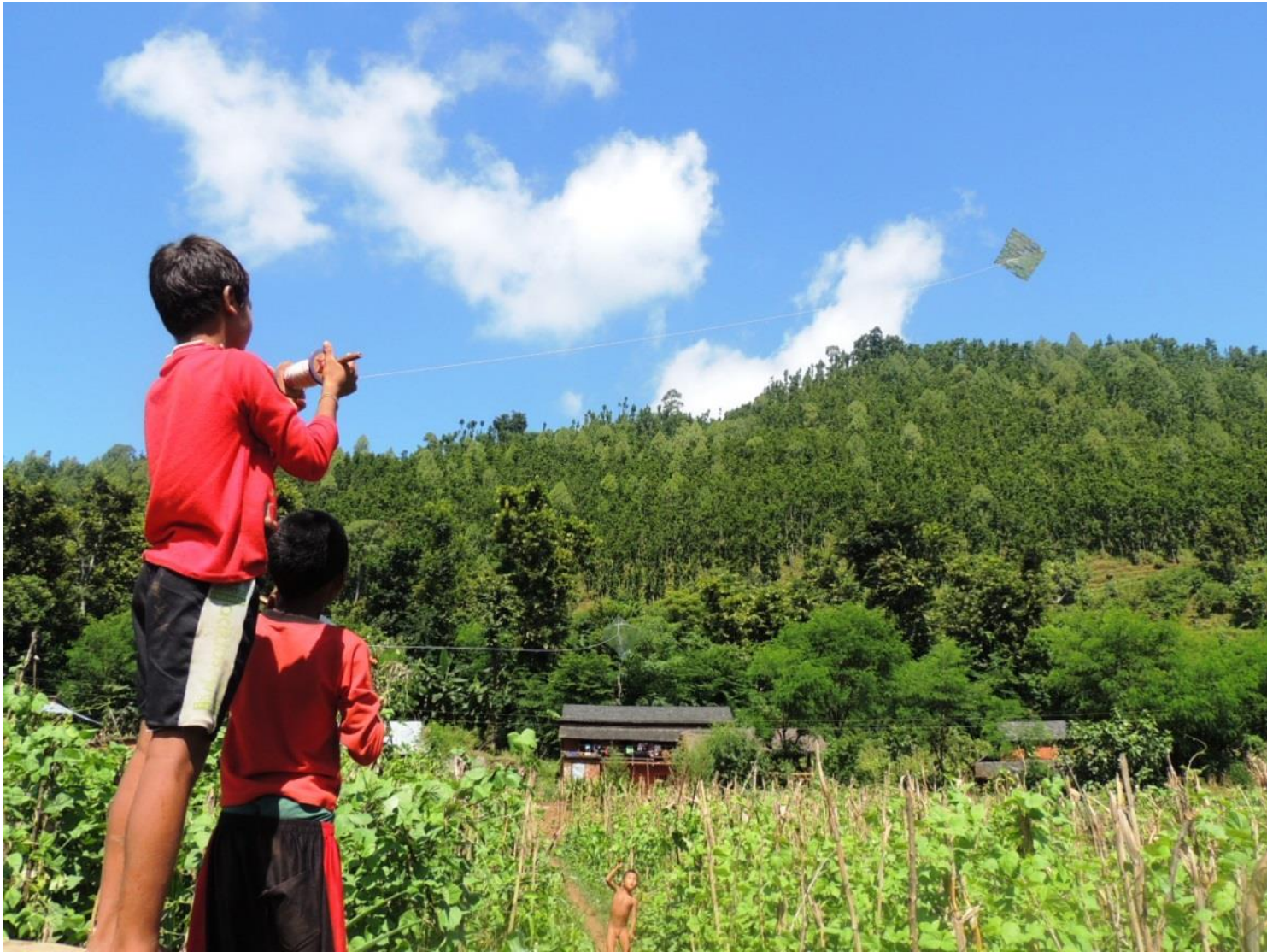
2012年9月 / ネパール・ダディン郡 / 撮影者 東航平

僕たちも休みの日は遊びます。川で泳いだり、サッカーをしたりします。 秋になるとお店で凧が売られます。どこまで飛ぶか、みんなで勝負します。