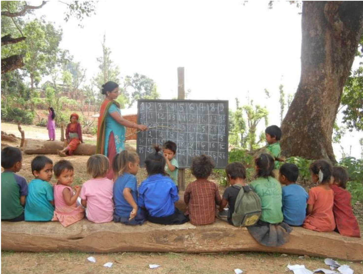
2012年5月 / ネパール・ダディン郡

僕の村は山の上。大きな木の下で勉強をしています。 もう少し大きくなったら、お兄ちゃんやお姉ちゃんたちと一緒に山の下の学校に通います。