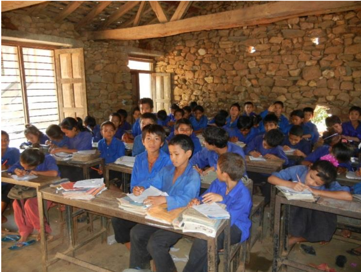
2011年8月 / ネパール・ダディン郡 / 撮影者 東航平

僕たちの学校は10時から16時まで。45分授業で7コマ勉強します。 朝や夕方は家の仕事を手伝うので忙しいけど、友達がいるから学校に行くことは楽しいです。 僕のクラスは59人いるから少し狭いかな。