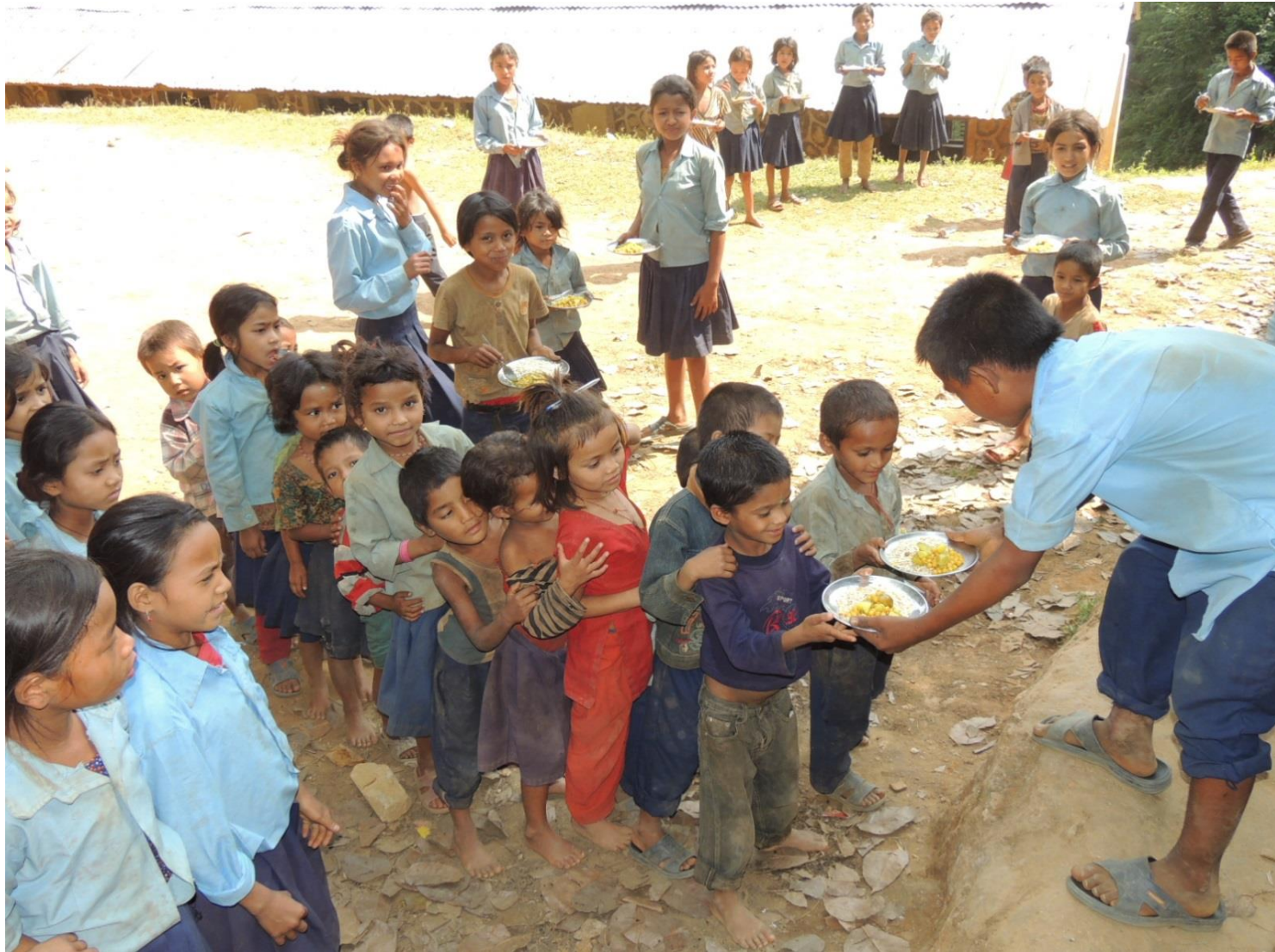
2012年10月 / ネパール・ダディン郡

僕の村はこの地域で一番貧しいのです。だから特別に学校で給食がもらえます。 メニューは干した米、カレー味のじゃがいもと豆、給食があるから学校に通います。