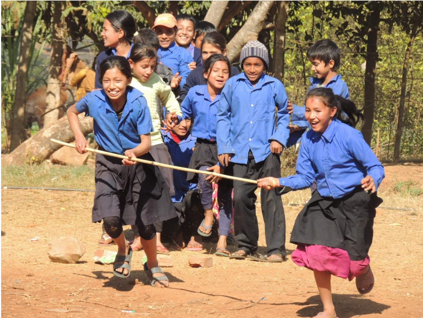
2013年1月 / ネパール・ダディン郡

わたしの学校では体育の授業はほとんど行われません。 ボールや道具もなければ、体操服もありません。それでも自然にあるものを使って体育はできます。 今日の競技は”タイフーン”。