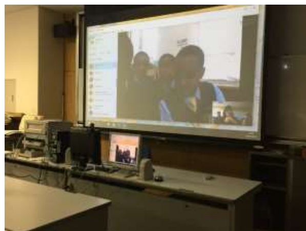
Nairobi School (ケニア) との交流セッション