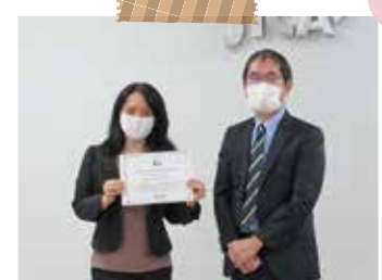
閉講式では参加者代表がパラグアイ事務所で修了書を受け取りました