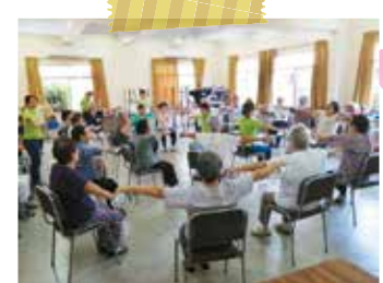
パラグアイでの福祉活動の様子 百歳体操