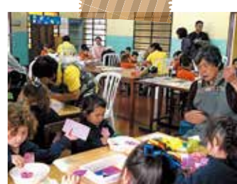
パラグアイでの福祉活動の様子 幼稚園の子どもたちとの七夕飾りづくりで交流