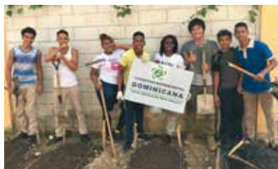
小学生と学校菜園を作りました！