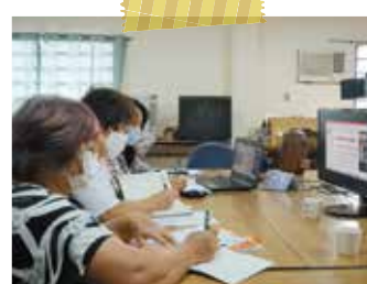
オンラインでの質疑応答で熱心にメモを取る参加者

映像教材での自己学習のあとメールやZoomを活用しての質疑応答や意見交換が行われました。専門的な内容で難しいと感じる部分もあったようですが、映像教材は繰り返し見ることができたので、その分疑問も浮かび、活発な質疑応答につながり、理解が深まったという声もありました。パソコンに触れることさえ慣れていない参加者もいましたが、対面で活動することがままならない状況でも、このプログラムのようにオンラインツールを活用することで、活動の継続はもちろん活動仲間との繋がりも保つことができると、前向きに今後の取り組みを考えていました。