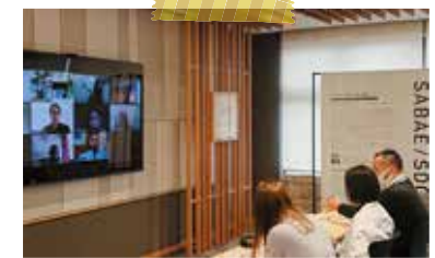
質疑応答にご対応頂く鯖江市の皆さま