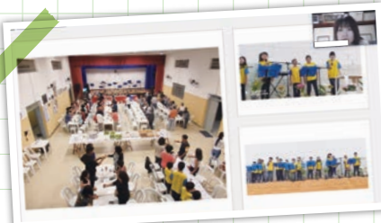
▲日本語学校の生徒発表会(歌・ダンス・演奏)の様子(第2回より)

JICA海外協力隊の応募に関心がある方はもちろん、開発途上国の現状についてご関心がある皆さまのご参加をお待ちしております。