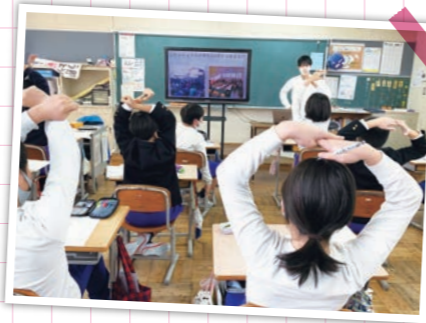
▲ホンジュラスクイズを交えながら出前講座をしている様子