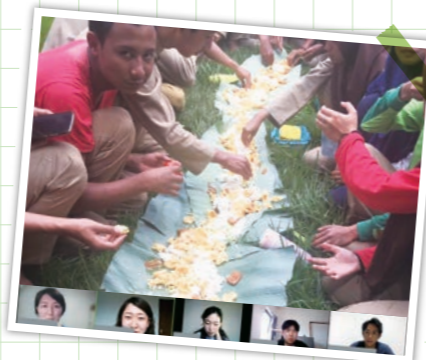
▲家族の様に接してくれる現地の人たちと(第1回より)

イベントの 詳細やお申込み、 今後のスケジュール についてはこちらの QRコードから!