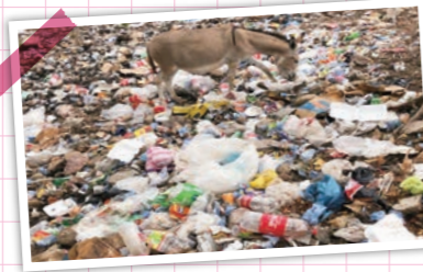
▲ホンジュラス現地の課題

ホンジュラスで体験した、人々の暮らしや文化などはもちろん、現地の課題解決のために行った活動などをお話しています。例えば、ホンジュラスと日本の学校の違い、生活していて驚いた現地の文化、ゴミのポイ捨てをなくすために奮闘した活動内容など、実際に現地に行った人ならではの貴重な体験談を聞くことができます。