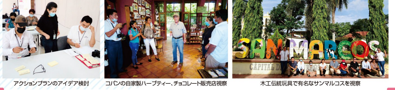
アクションプランのアイデア検討 コパンの自家製ハーブティー、チョコレート販売店視察 木工伝統玩具で有名なサンマルコスを視察

本プロジェクトは、グアテマラの世界複合遺産ティカル国立公園周辺コミュニティの住民が、世界遺産を活用して生活向上を目指すことを支援しています。この度、ティカルと同様にマヤ文明の世界遺産を擁し観光に活かしている隣国ホンジュラスのコパンを訪問し、同コミュニティ住民リーダーの生活向上への取り組みを学ぶ第三国研修を実施しました。今回の研修を通じ、農業観光分野の研修員が「コパンの店舗の洗練された製品を見て、ぜひ自分たちの活動にも取り入れたい」と意気込んでいたのが印象に残りました。本研修がティカルでの今後の持続的な活動に役立つことを期待しています。