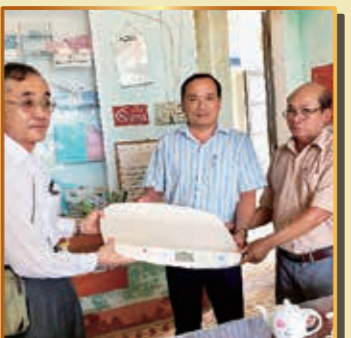
低体重児の発育状況調査に不可欠な体重計(ベビースケール)の供与