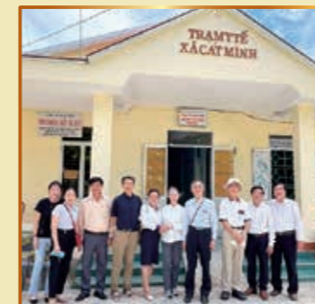
ビンディン省フーカット県キヤトミンコミュニティ医療センターの関係者とともに

2019年に本プロジェクトはスタートし、2回の現地研修を実施しましたが、コロナ禍のため約2年半訪越が中断しました。その間、オンラインで18コミュニティのヘルスセンタースタッフ・健康推進員への研修や「授乳ケア」の専門指導者による研修を実施しました。2022年は6月と9月に現地を訪れ、PhuCat医療センターと12ヘルスセンターにベビースケールを贈呈し、低体重出生児の家庭を訪問して成育状況を確認しました。双子や早産が原因とされていますが、浅井戸を生活用水に利用している家庭もあり、今後は母乳のダイオキシンや臍帯血のホルモンを測定する予定です。