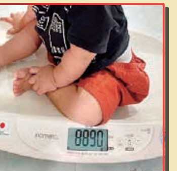
ベビースケールで乳児の成長を確認しながらの母子保健指導