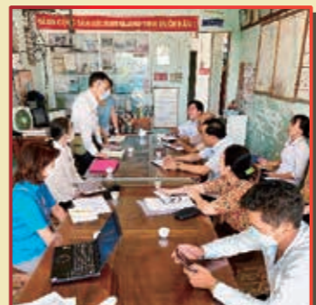
フーカット県コミュニティ医療センター関係者との協議