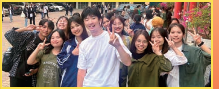
日本語を学ぶ学生たちと

「たけそ〜ん!」ハノイの街を歩くと一日に何度も、ベトナムの若者たちが声をかけてくれます。たけそ〜んとは、いわば私の芸名。担当番組を広める目的で始めたTikTokは、開始から3ヶ月でフォロワー30万人を突破。映えない40歳が有名人扱いされることに戸惑いながらも、「日本が大好き」と目を輝かせる若者と交流できることを、本当に嬉しく思っています。ベトナムの国営局・ベトナムテレビ(VTV)で日本語番組の制作に携わる活動も、残り一年を切りました。こちらでの経験を石川県そして日本に還元できるよう、今後も常に考え、行動します。