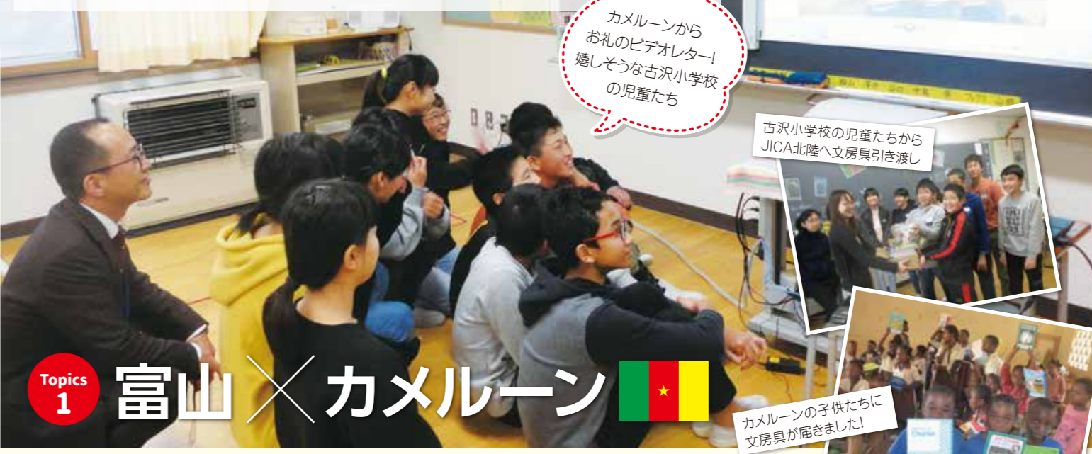
カメルーンからお礼のビデオレター! 嬉しそうな古沢小学校の児童たち

古沢小学校の6年生11名がJICAの出前講座をはじめ、様々な方からお話を聞き、「開発途上国の子供たちのために何かしたい!」と思いから、カメルーンの子供たちへ文房具を寄付しました。全校生徒へ呼びかけて集まった文房具は、JICA北陸を通して、富山県出身の青年海外協力隊員に渡し、現地の子供たちへ寄付され、そのお礼として動画と手紙が届きました。それを見た児童は、「送ってよかった!」笑顔で勉強してほしい!「(学習を通して)自分が広がった」と感じたようです。