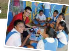
日本の茶道体験も