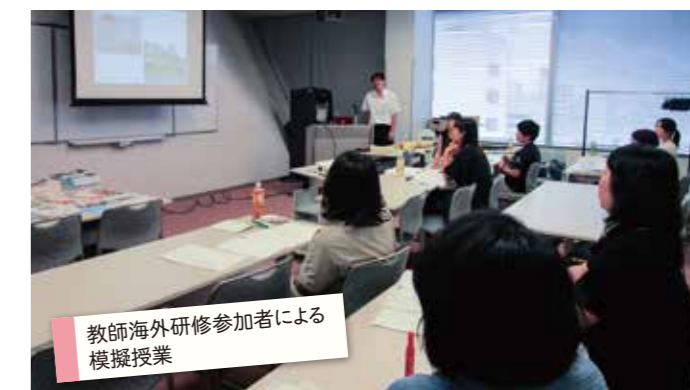
教師海外研修参加者による模擬授業

国際交流と国際協力を学ぶ学生向けプログラムを毎年全5回シリーズで開催しています。第1回では、SDGs(持続可能な開発目標)を使って、世界に存在する様々な問題・課題への理解を深めました。貧困の裏には様々な別の問題が背景にあること、一つの課題を放置していると他の問題を引き起こすことに繋がること。他にも、複雑に絡まり合うSDGsの達成には世界中が協力し総合的にアプローチしていくことが重要であると理解出来た回でした。