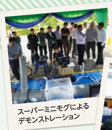
スーパーミニモグによる デモンストレーション