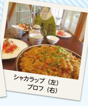
シャカラップ(左) プロフ(右)

8月24日、石川県出身の元青年海外協力隊を講師にキルギス料理教室を開催しました!作ったのはプロフ(炊き込みご飯)とシャカラップ(トマトサラダ)。当日はキルギス文化の話や青年海外協力隊の体験談発表もしました。お子さんから大人まで幅広い年代の方に参加いただき、「家でも作りたい」「キルギス文化も知れて良かった」と感想もいただきました!