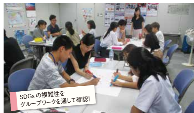
SDGsの複雑性をグループワークを通して確認!