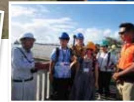
日本の技術でサモアに橋を建設