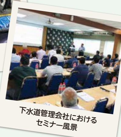
下水道管理会社における セミナー風景