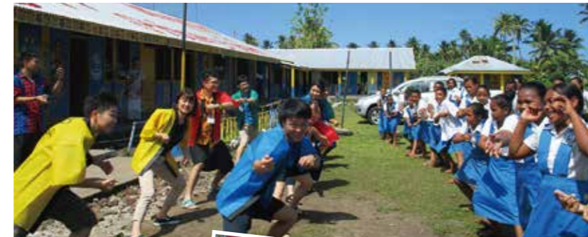
青年海外協力隊の活動する小学校を訪れ、子供たちとソーラン節を踊りました

JICA北陸では、学校教員の方々向けに、開発途上国での実体験型研修プログラムを通し、学んだ内容を直接教育現場に還元して頂く「教師海外研修」を実施しています。本事業は生徒達との距離が近い教員の方々に日本では経験出来ない異文化・途上国体験を提供し、教育現場での国際理解授業を通して次代を担うグローバル人材を育成することを目的としています。2019年度は大洋州の島サモアを訪問しました!現地の学校、教育省、博物館など沢山の場所を訪問するだけでなく、1泊2日のホームステイ、青年海外協力隊が活動している現場の視察(気象庁など)も行いました!参加した先生の感想を紹介します。