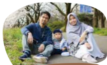
ご家族とイマームさん(左)

ここでは機械学習に関連した研究を行っています。研究活動のための充実した施設、設備が整えられており、研究に集中することが期待されているんだということを実感しました。また大学では留学生を対象にした日本語講座も充実していて、日本で生活を送るのとても役立っています。金沢大学での学生生活はとても楽しく充実していると感じています。