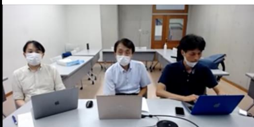
海外研修員も参加した 事前説明会の様子 (於 富山国際大学)

スリランカ、マーシャルのエネルギー分野に携わる若手行政官(20～30代)の10名が、 富山の事例を中心に、日本の再生可能エネルギーの基本的な技術とシステムに関する知識を学び、リアルタイムで記録されるグラフィックレコーディング(グラレコ)で議論の「可視化」 を通じて理解を深めます。また終盤では自国の課題解決に向けた事業計画「アクションプラン」の発表会が行われます。