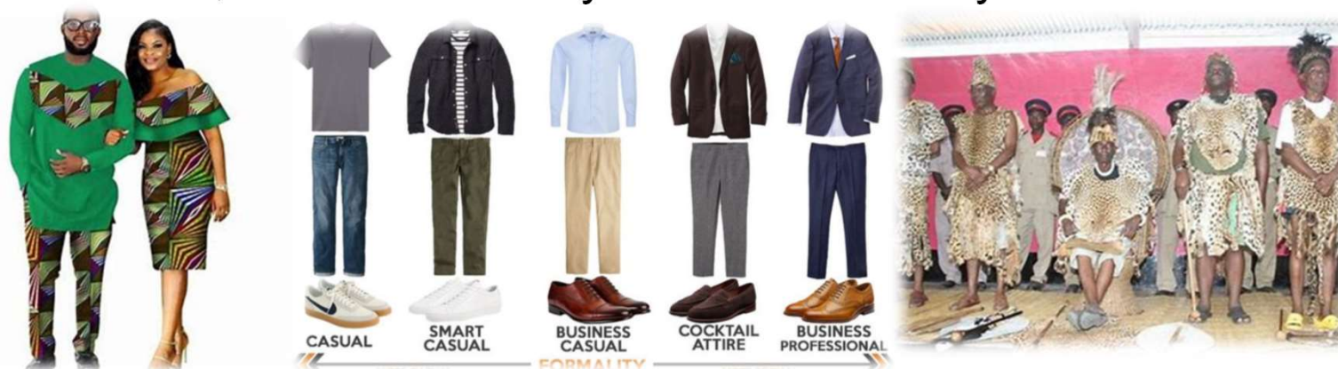
Cold and Hot season dressing (寒い季節・暑い季節の服装)