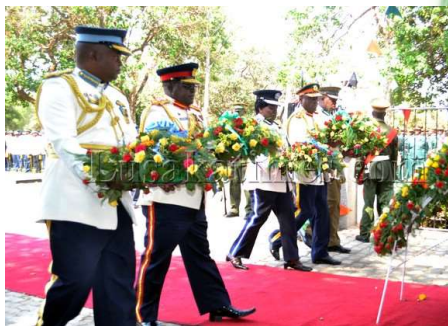
Wreath laying (花輪)