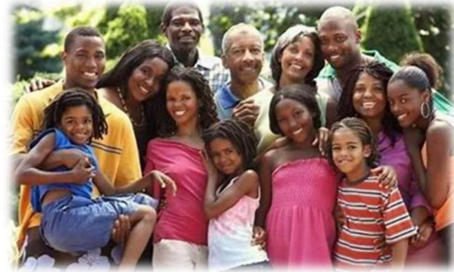
Typical Extended (典型的な大家族)