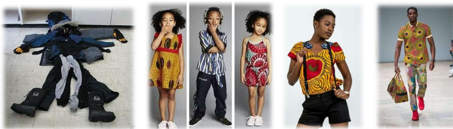
Depending on season and occasion the above can be worn (季節や機会に応じて、このような服を着ています。)