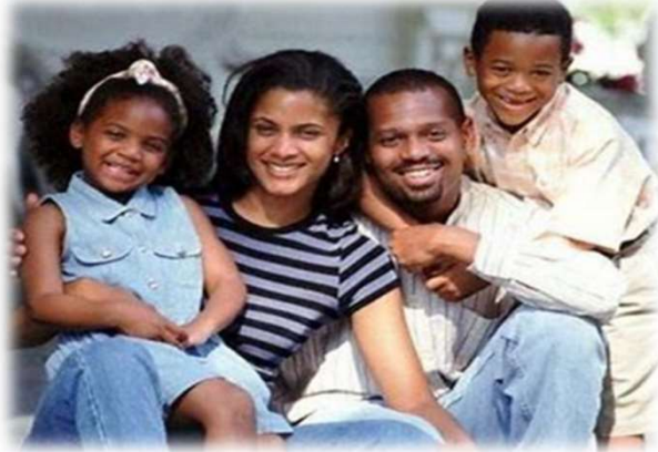
Typical Nuclear (典型的な核家族)