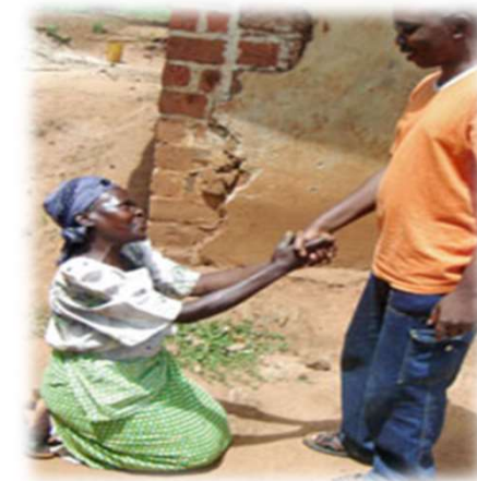
Typical Greetings (一般的なご挨拶)