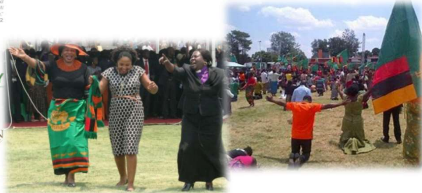
Prayers/thanks (祈り/感謝を与える)