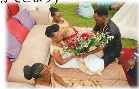
Traditional (トラディショナル)