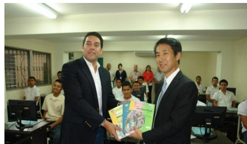
El Director de JICA entrega manuales donados al Director del INFOP

Tegucigalpa. La Agencia de Cooperación Internacional del Japón (JICA), donó al Instituto Nacional de Formación Profesional (INFOP) 8,900 ejemplares de manuales didácticos que fueron elaborados con la asesoría de expertos japoneses, con el fin de ser utilizados por los participantes e instructores en los diferentes talleres que imparte esta institución profesional.