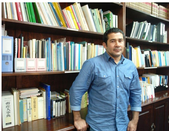
Alrededor 2,600 hondureños ha capacitado JICA a través del Programa de Becas

Cabe destacar que para JICA el propósito del Programa de Capacitación y Diálogo es ayudar a los países en vías de desarrollo en su esfuerzo por lograr los objetivos de mejora integral, apoyar el desarrollo de recursos humanos en las áreas prioritarias establecidas según la Política Nacional de Desarrollo de cada país; en el caso particular de Honduras JICA ha enfocado actualmente su actividad en cuatro áreas prioritarias: Desarrollo Rural, Cambio Climático, Salud y Educación.