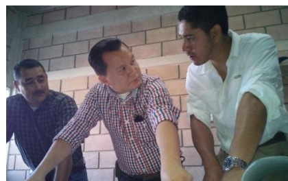
Expertos salvadoreños en el Manejo Integral de Desechos Sólidos se reúnen con equipo técnico

Tegucigalpa. Con el propósito de fortalecer las capacidades locales bajo un enfoque de Desarrollo Rural Territorial (DRT), la Agencia de Cooperación Internacional del Japón (JICA), mediante la asistencia técnica, a través del envío de expertos salvadoreños, visitaron la Mancomunidad Valle de Sensenti (MANVASEN) y la de Güisayote en el departamento de Ocotepeque, para desarrollar una gestión integral de los residuos sólidos en el "Valle de Sensenti".