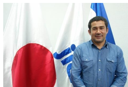
El exbecario de JICA participó en el curso Desarrollo Rural Participativo

A través del Programa de Becas alrededor de 2,600 hondureños se han capacitado desde la década de los 60’s en distintas especialidades de la mano de expertos.