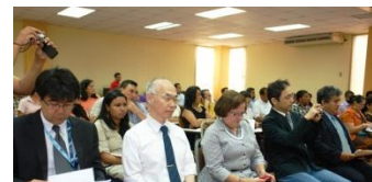
Experto Japonés imparte capacitación sobre la Enseñanza de la Matemática