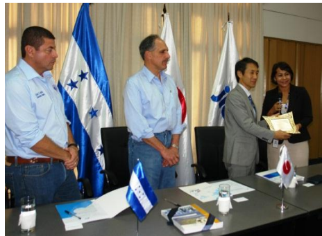
UPI entregó un reconocimiento especial a JICA por el trabajo realizado en beneficio de la comunidad Hondureña

Por su parte, el Alcalde Capitalino expresó que “El pueblo y gobierno del Japón siempre está ayudando al gobierno hondureño y sobre todo a nuestra querida Tegucigalpa. Gracias a JICA tenemos planos y manuales, material que nos va a servir para mitigar y resolver los problemas de la naturaleza y así poder ayudar a las personas que más lo necesitan”.