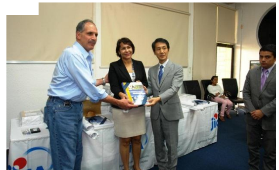
Durante el acto el Director de JICA y UPI entregó 600 Manuales para la elaboración del Mapa de Inventario de Deslizamientos de Tierra al Alcalde