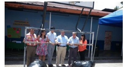
Funcionarios de SERNA y JICA cortan la cinta inaugural del proyecto ambiental

El objetivo del programa es que los estudiantes de los centros educativos: José Castro López, Dr. Miguel Paz Barahona y Pedro Nufio participen voluntariamente en un proceso de sensibilización, para promover la separación de residuos sólidos valorados por empresas privadas para así mejorar el entorno ambiental de cada centro escolar. "El fin no es comercial, ni laboral porque son menores de edad", indicó la ex becaria de JICA y Analista Ambiental de la SERNA de la Regional Noroccidental.