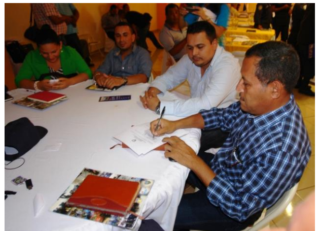
Alcaldes firman compromiso de seguridad