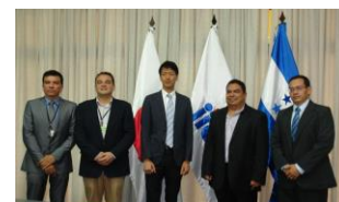
JICA firma acuerdo de cooperación

Tegucigalpa. Con el objetivo de prevenir la mortalidad materna e infantil en el Hospital Gabriela Alvarado en la ciudad de Danlí y en el Hospital San Felipe de Tegucigalpa, se llevó a cabo la Firma del Acuerdo de Cooperación del Proyecto “Manejo Estandarizado de Emergencias Obstétricas”.