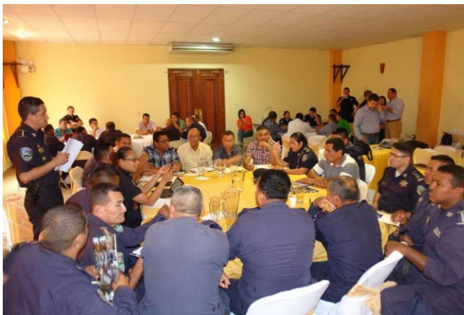
Líderes, gobierno local y Policías reunidos en Taller de Policía Comunitaria

Cabe destacar, que durante el desarrollo del seminario los alcaldes, vice alcaldes, líderes comunitarios y los miembros de la policía trabajaron en equipo, ya que se dividieron en grupos de trabajo de acuerdo a la ubicación de sus comunidades.