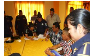
Alcaldes firman compromiso de seguridad

Juticalpa, Olancho. Con el propósito de establecer estrategias de seguridad, miembros de la Policía Nacional de Honduras y de las Alcaldías de Juticalpa y Olancho, firmaron un compromiso de seguridad, que tiene como objetivo contribuir a mejorar la seguridad de cada una de sus comunidades.