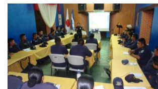
El Taller se realizó con apoyo de JICA

Comayagua. Con el propósito de formar en Policía Comunitaria y que estos sean efecto multiplicador para sus municipios, se inauguró una jornada de capacitación de ocho días acerca de la filosofía de Policía Comunitaria a través de un taller, donde participaron miembros de la Policía Nacional de Comayagua e Intibucá.