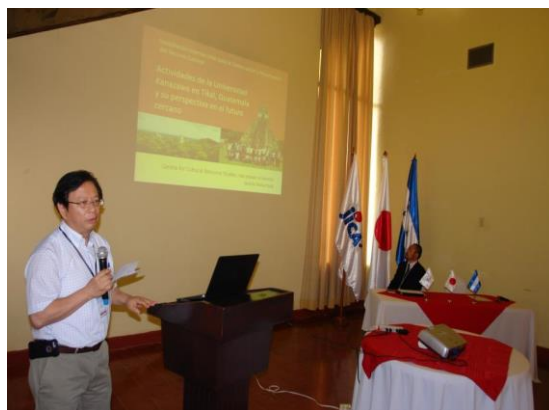
El Simposio Internacional de Turismo se realizó en Copán Ruinas