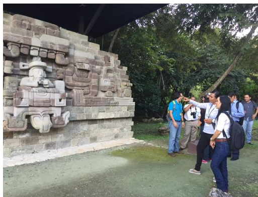
Participantes del Simposio Internacional de Turismo visitaron el Parque Arqueológico Rastrojón