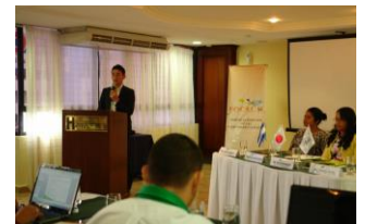
Con apoyo de JICA se realizó la Asamblea

Tegucigalpa. Con la participación de representantes del Gobierno Central y Local, de la Asociación de Municipios de Honduras (AMHON), Gerentes de las Unidades Técnicas Intermunicipales (UTIS), quienes gerencia igual número de Mancomunidades y de la Cooperación Internacional, se llevó a cabo la Asamblea de la Red de UTIS.