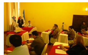
Simposio Internacional de Turismo

Copán Ruinas. Con el propósito de construir una red de la cooperación recíproca entre los países del Plan Trifinio, al compartir las informaciones sobre el estado actual y problemáticas de la conservación y utilización turística de los recursos culturales de la civilización maya, el Director General de la oficina de la Agencia de Cooperación Internacional del Japón (JICA) en Hokuriku, Masato Koinuma, y el catedrático y arqueólogo, Seiichi Nakamura, de la Universidad de Kanazawa de Japón, inauguraron el Simposio Internacional de Turismo: Situación Actual y Desafíos del Desarrollo Turístico con Recursos Culturales en Guatemala, El Salvador y Honduras.