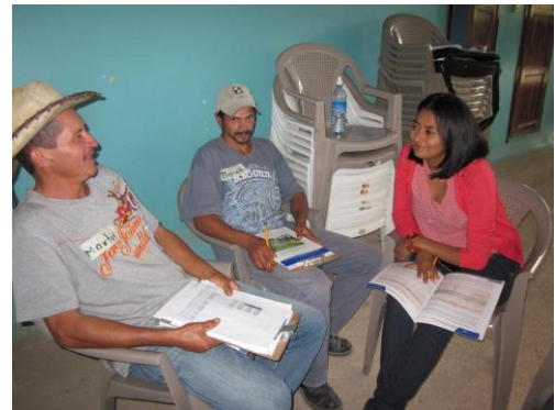
Exitosos logros presenta Misión evaluadora de JICA sobre Proyecto FOCAL II