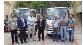
Entrega de vehículos

Tegucigalpa. Con el fin de fortalecer la logística de recolección de residuos sólidos aprovechables y hospitalarios al transportar de manera adecuada los residuos al Valle de Sensenti, la Agencia de Cooperación Internacional del Japón (JICA), realizó la entrega de vehículos a la Mancomunidad Güisayote y Valle de Sensenti (MANVASEN) en el departamento de Ocotepeque.