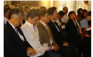
Entrega de PDMs

Tegucigalpa. Con el fin de fortalecer la gestión de los gobiernos locales y las mancomunidades, los Planes de Desarrollo Municipal, ya son una realidad en el país, gracias al Proyecto “Fortalecimiento de la Capacidad para el Desarrollo Local (FOCAL II) que ejecuta la Agencia de Cooperación Internacional del Japón (JICA) en forma conjunta con la Secretaría de Derechos Humanos, Justicia, Gobernación y Descentralización (SDHJGD), en coordinación con la Asociación de Municipios de Honduras (AMHON).