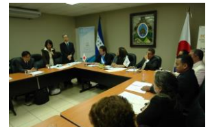
Reunión CCC de Proyecto Focal

Tegucigalpa. Alrededor de 1.4 millones de habitantes de 6,817 comunidades de 149 municipios de 33 mancomunidades han sido beneficiadas a través del Proyecto de Fortalecimiento de la Capacidad para el Desarrollo Local (FOCAL II), que ejecuta la Agencia de Cooperación Internacional del Japón (JICA), la Secretaría de Derechos Humanos, Justicia, Gobernación y Descentralización (SDHJGD), en colaboración con la Asociación de los Municipios de Honduras (AMHON) y la Secretaría de Coordinación General del Gobierno (SCGG).