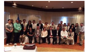
Conferencia Seikatsu Kaizen