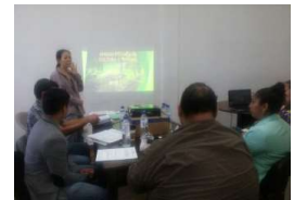
Turismo sostenible apoya JICA

Copán Ruinas. Con el objetivo de fortalecer y apoyar el desarrollo del turismo sostenible e inclusivo con amplia participación de los ciudadanos en el municipio de Copán Ruinas, mediante la asistencia técnica, la experta japonesa en desarrollo participativo, Chiaki Narita, de la Agencia de Cooperación Internacional del Japón (JICA), obtuvo significativos resultados en el occidente del país.