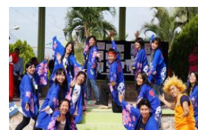
Nuevo funcionario de JICA

Tegucigalpa. Cane, La Paz. El municipio de Cane en el departamento de La Paz se vistió de fiesta para celebrar la Feria de la Cultura Japonesa que organizó un grupo del Programa de Voluntarios Jóvenes (JOCV) de la Agencia de Cooperación Internacional del Japón (JICA) que se encuentran asignados a nivel nacional del territorio hondureño.