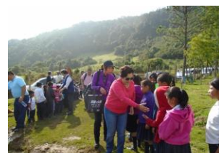
Misión visita comunidades

Yamaranguila, Intibucá. Con un caluroso abrazo y un saludo de buenos días fue recibida la misión conformada por representantes de la Agencia de Cooperación Internacional del Japón (JICA) El Salvador y autoridades del gobierno salvadoreño, por parte de los niños del Centro de Educación Básica “José Cecilio del Valle” de la comunidad de Zacate Blanco, ubicada en el municipio de Yamaranguila, en el departamento de Intibucá.