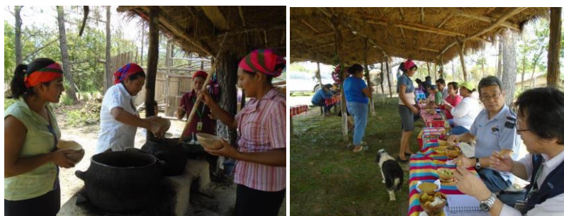
El comité de turismo de la comunidad de Los Mangos recibió a la Misión salvadoreña y japonesa