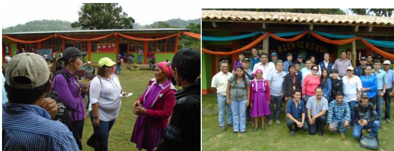
La Misión salvadoreña y japonesa visitó la comunidad de Zacate Blanco

Recordó que cuando expertos japoneses de JICA llegaron a la comunidad de Los Mangos, bajo los Planes de Desarrollo Comunitario (PDC) y les empezaron a preguntar que tenían fue cuando la comunidad miró a su alrededor y se dieron cuenta que no eran pobres, sino que no valoraban lo que tenían, pero que ahora miran de una forma diferente ya que están seguros de lo hacen y que las personas pueden salir adelante; por lo que, agradeció a las instituciones que los apoyan porque son su mano derecha.