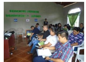
Misión salvadoreña y japonesa

San Juan, Intibucá. Una misión conformada por representantes de la Agencia de Cooperación Internacional del Japón (JICA) El Salvador y autoridades del gobierno salvadoreño visitaron Honduras, con el fin de conocer la experiencia hondureña sobre el proceso de planificación en Mejoramiento de Vida (Seikatsu Kaizen) que municipios de la Mancomunidad MANCURISJ han implementado en materia de planificación municipal y desarrollo económico local con el apoyo de JICA Honduras y el gobierno hondureño.