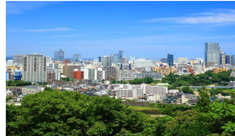
Central area of Sendai city