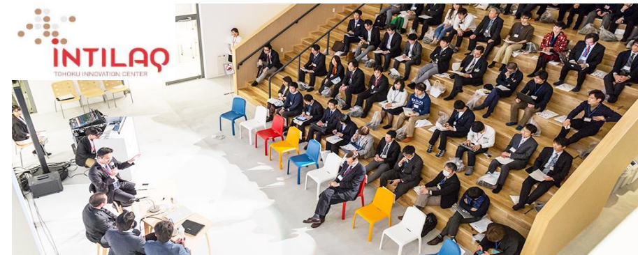
仙台市の社会起業家支援プログラム/施設の一例