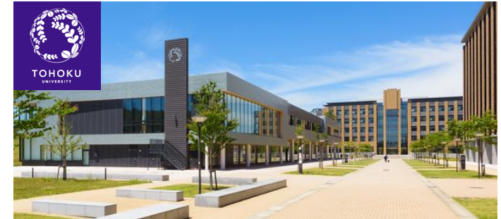
Tohoku University Aobayama Campus