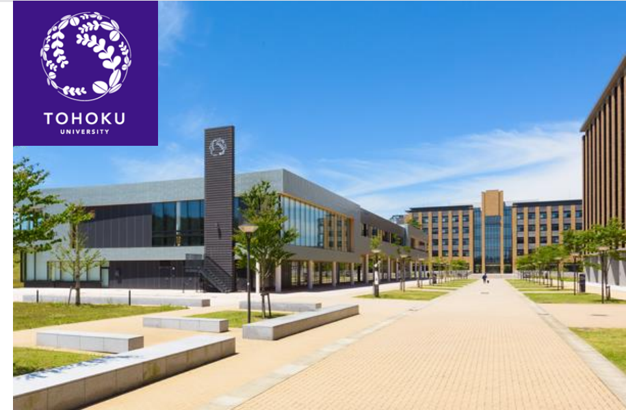
東北大学 青葉山キャンパス