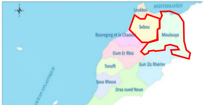
モロッコ国における流域位置図（抜粋、赤枠は調査対象流域）