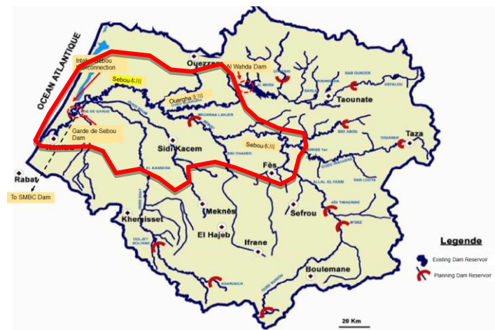
Sebou 流域（赤枠は調査対象流域）