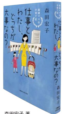
森田宏子 著 文藝春秋企画出版部 1,512円(税込)

国連で30年にわたるキャリアを持つ著者。国連職員だろうとどんな職業だろうと、急に子どもが病気になることもあれば、日々の食事を用意したり勉強を教えたり、時には子どもの友人問題まで、子どもの成長とともにさまざまな育児の壁にぶつかるのに変わりはない。それでも、「どんなに大変でも、仕事と家庭のふたつの世界があることは救いだった」と振り返る。女性のキャリアと育児の両立を目指し、子どもの力を信じて壁を乗り越えたワーキングマザーの奮闘記。