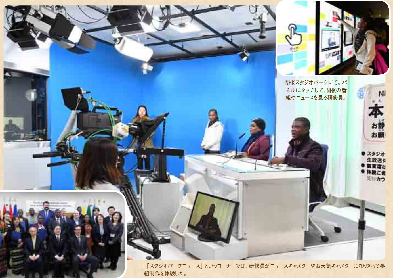
NHKスタジオパークにて。パネルにタッチして、NHKの番組やニュースを見る研修員。