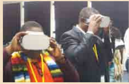
NHK大阪放送局では、最新VRを体験。

NHKにある複数の施設を訪れ、ドラマやバラエティの制作現場や報道現場を見学。NHKの地方局は新人を育てる人材育成の場でもあること、NHK放送技術研究所ではレベルの高い基礎研究を行い、その成果は企業が自由に使えること、基幹局が災害などでダメージを受けたときのバックアップ態勢があることなどを学んだ。