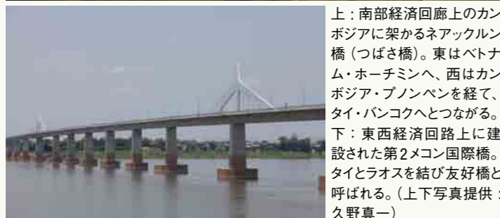
上：南部経済回廊上のカンボジアに架かるネアックルン橋（つばさ橋）。東はベトナム・ホーチミンへ、西はカンボジア・プノンベンを経て、タイ・バンコクへとつながる。 下：東西経済回路上に建設された第2メコン国際橋。タイとラオスを結び友好橋と呼ばれる。