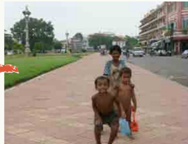
物乞いをする子どもたち（2004年9月2日）。