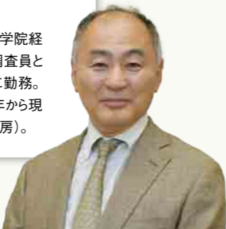
写真・データ提供：石田正美

1960年生まれ。成蹊大学法学部卒業。インドネシア大学大学院経済学研究科博士課程修了（経済学博士）。外務省専門調査員として在マレーシア日本大使館勤務後、アジア経済研究所に勤務。在ジャカルタ海外派遣員、バンコク事務所などを経て2019年から現職。近著に『タイ・プラスワンの企業戦略』（共編、勁草書房）。