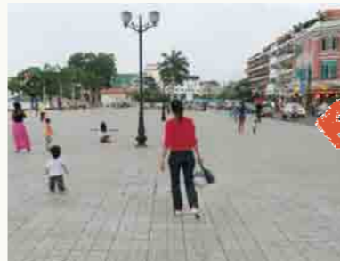
子どもたちを遊ばせる様子（2013年11月6日）。