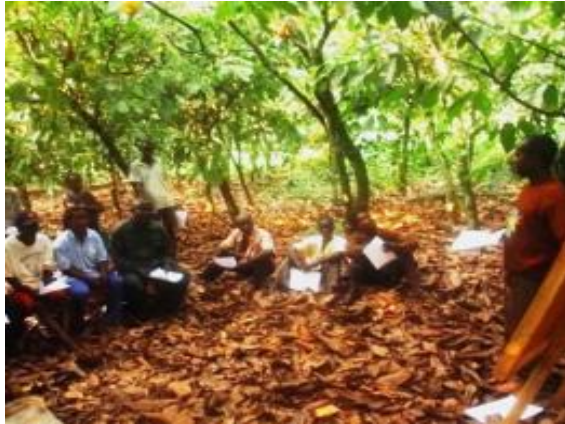
農家のトレーニング