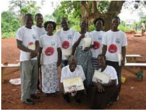
子ども保護委員会 (CCPC)