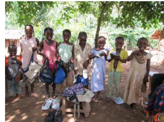
子どもの教育へ投資、還元