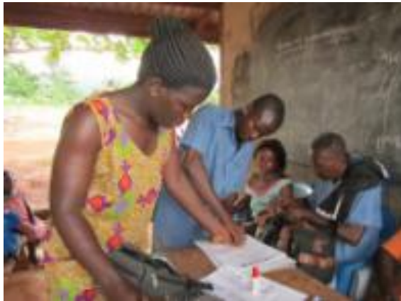
貯蓄・小規模融資制度を通じた助け合いの仕組み