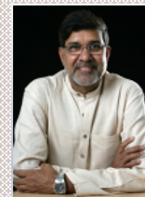
2014年ノーベル平和賞 受賞者カイルシュ・ サティヤルティ氏 が創設

※児童労働とは、15歳未満の義務教育を妨げる労働、18歳未満による危険有害労働で、国際条約や国内法で禁止されている、18歳未満の子どもによる労働をさす。