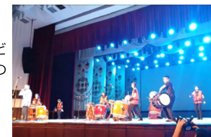
“大江戸太鼓”コンサート

KRJC図書館では専門書、語学学習、漫画など1万冊を超える各国語の蔵書を有しています。