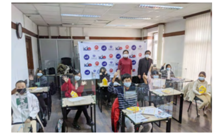
ジュニアコースの開催

日本企業の現地スタッフに対する日本語教育や、高度人材としての日本での採用を前提とした日本企業からの受託コースなど、日本のお客様の要望に応じたコースを可能な限り開設しています。