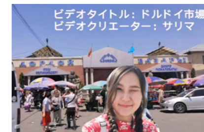
ビデオコンテスト出典作品の例

年4回程度開催の「日本語で話そう会」「日本語プレゼン会」では、日本語に興味のあるキルギスの人々と日本人のオンラインも活用した交流の場を提供しています。また、日本語を学ぶキルギスの方々が作成する日本語ビデオコンテストを開催しています。