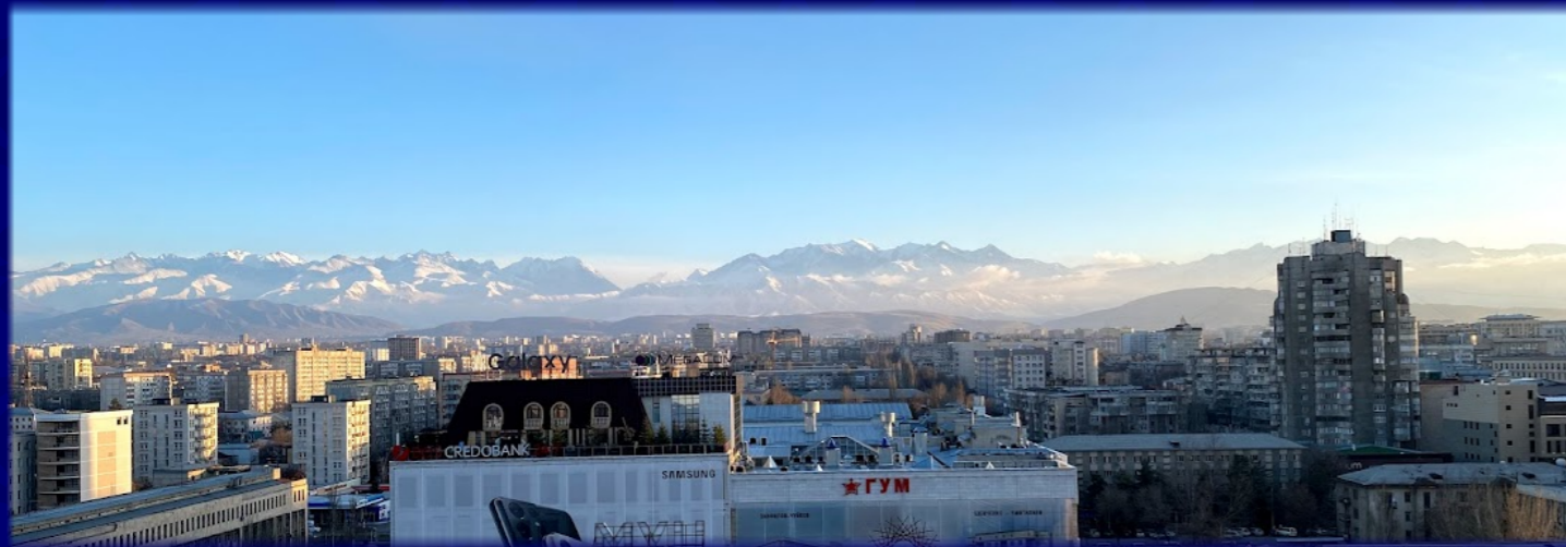
首都ビシュケクの風景