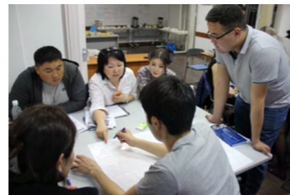
‘mini-MBA’での白熱した議論