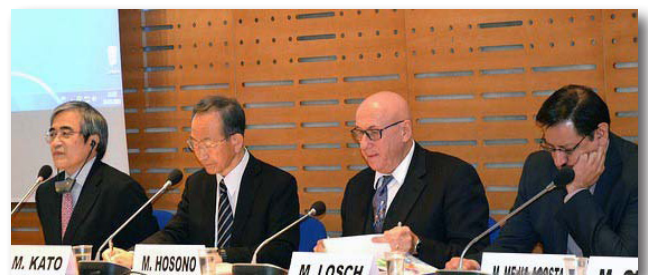
研究成果報告の様子

Growth is Dead, Long Live Growth: The Quality of Economic Growth and Why it Matters