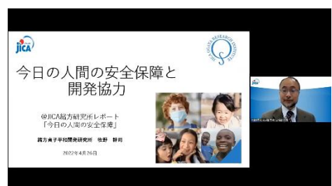
JICA緒方研究所レポート 「今日の人間の安全保障」創刊記念シンポジウム

また、JICA開発大学院連携事業の一翼を担う機関として同事業を推進し、日本が培った経験を積極的に発信します。併せて人材育成の機能と研究交流の拠点としての機能を一層強化します。