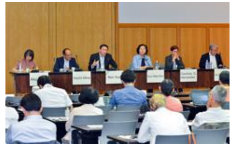
書籍発刊記念シンポジウム「ASEAN+3における人間の安全保障の実践：研究と実務からの提言」では活発な意見交換があった

人間の安全保障の実践は数年以上にわたり取り組んでいるテーマで、変化する時代に対応しうる人間の安全保障とはいかなるものか探求しています。また、平和構築も同様に重要なテーマで、紛争影響下にある社会において持続的な平和を促進する要因や阻害要因を分析しています。これらの研究を通じて、人道対応、持続的な開発、持続的な平和に従事する多様な主体による取り組みを比較分析することにより、課題に対処する有効な支援のあり方を探ります。