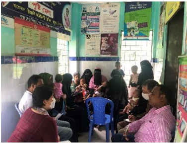
バングラデシュでの調査

この数十年に世界的な大きな前進があった一方で、従来からの貧困、ジェンダー、居住地域などによる格差の問題に加え、経済発展に伴う人々のニーズの変容、COVID-19などの感染症流行、紛争・災害といった状況変化の中で、すべての人に届く良質な教育、保健サービスの保障、一人一人のエンパワメントに一層取り組んでいく必要があります。