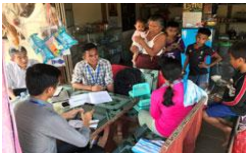
カンボジアでの家計調査の様子

貧困削減は依然として世界的な開発課題です。また、一定程度発展を遂げた国々の中にも格差の問題や社会開発の遅れなどに直面している国もあり、包括的で持続可能な、質の高い成長が求められています。