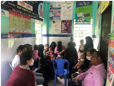
バングラデシュでの調査

この数十年に世界的な大きな前進があった一方で、従来からの貧困、ジェンダー、居住地域などによる格差の問題に加え、経済発展に伴う人々のニーズの変容、COVID-19などの感染症流行、紛争・災害といった状況変化の中で、すべての人に届く良質な教育、保健サービスの保障、一人一人のエンパワメントに一層取り組んでいく必要があります。