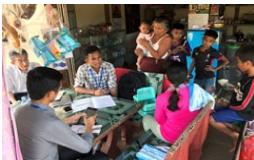
カンボジアでの家計調査の様子

貧困削減は依然として世界的な開発課題です。また、一定程度発展を遂げた国々の中にも格差の問題や社会開発の遅れなどに直面している国もあり、包括的で持続可能な、質の高い成長が求められています。