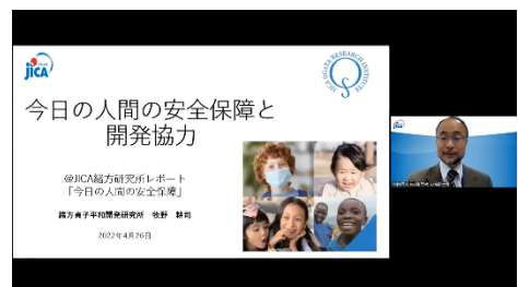
JICA緒方研究所レポート 「今日の人間の安全保障」創刊記念シンポジウム

また、JICA開発大学院連携事業の一翼を担う機関として同事業を推進し、日本が培った経験を積極的に発信します。併せて人材育成の機能と研究交流の拠点としての機能を一層強化します。