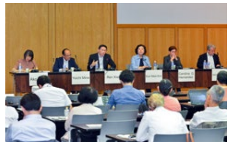
書籍発刊記念シンポジウム「ASEAN+3における人間の安全保障の実践：研究と実務からの提言」では活発な意見交換があった

人間の安全保障の実践は数年以上にわたり取り組んでいるテーマで、変化する時代に対応しうる人間の安全保障とはいかなるものか探求しています。また、平和構築も同様に重要なテーマで、紛争影響下にある社会において持続的な平和を促進する要因や阻害要因を分析しています。これらの研究を通じて、人道対応、持続的な開発、持続的な平和に従事する多様な主体による取り組みを比較分析することにより、課題に対処する有効な支援のあり方を探ります。