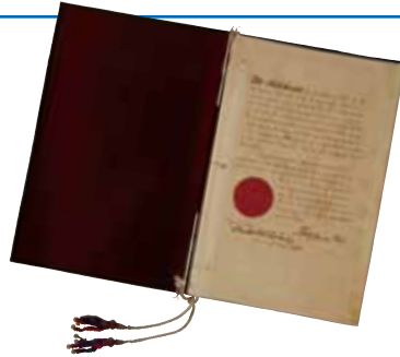
「日布渡航条約(批准書)」(外務省外交史料館所蔵) ハワイ国側批准書 1886年

150年前の1868年、横浜から出港した約150人の日本人がハワイへ到着しました。これが日本からハワイへの集団移住の始まりとされます。この後、明治維新により江戸時代は終わり、彼らはのちに「 がんねんもの 元年者」と呼ばれました。