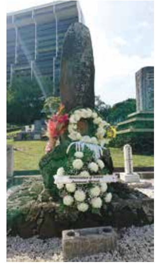
ホノルル市マキキ墓地内に建つ 「明治元年渡航者の碑」2018年

本展示では、元年者に始まったハワイ初期移民の歴史とハワイで発行された日本語新聞が日系社会で果たした役割をパネルで解説するほか、外務省外交史料館が所蔵する条約書や元年者に関する貴重な史料を展示します。