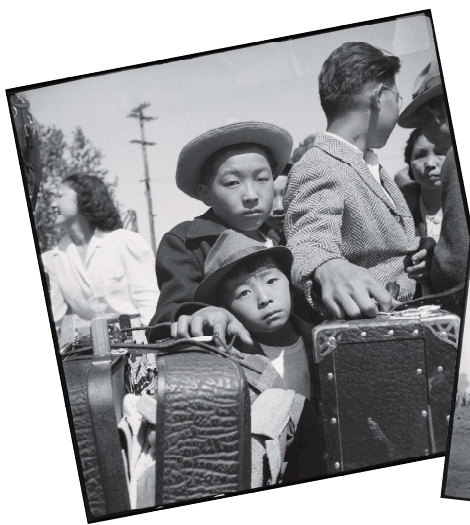
Dorothea Lange, Turlock, California, May 2, 1942

Please partner with us to share this critical story. "It was a failure of American democracy, and yet because most Americans are not aware of that dark chapter of American history, it's about to be repeated." – George Takei, Actor and Activist