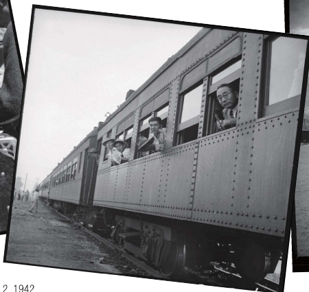
Dorothea Lange, Woodland, California, May 20, 1942