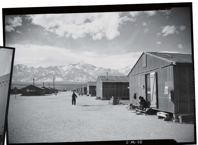
Ansel Adams, Manzanar Relocation Center, California, Library of Congress

3 月 10 日の上映後は、出演者の Satsuki Ina (サツキ・イナ) 氏に解説いただきます (通訳つき)。収容所内で撮影された未発表写真の数々を、それぞれの写真家の視点の違いを浮き彫りにして紹介します。ぜひお越しください。