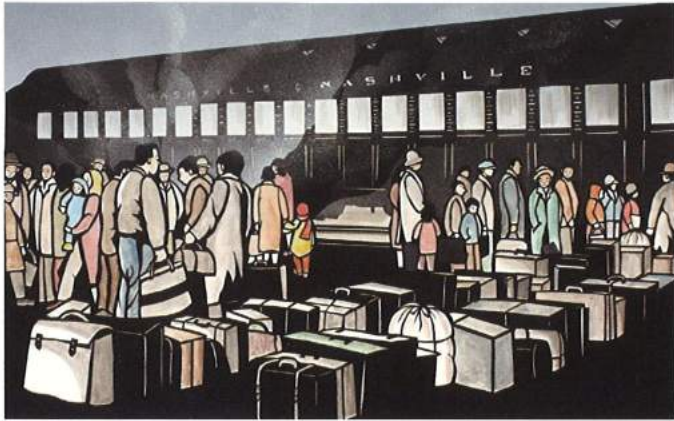
"Leaving" Aki Sogabe, 2005 収容所に向かう列車に乗り込む人々