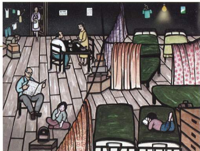
"Shared Room" Aki Sogabe, 2015 ロープやシーツで教室を区切って生活していた

居住者たちが徐々にハントホテルを離れ始めると、日本語学校を再開させる計画が動き始めました。まだ数人の居住者が残っていたものの、1956年までに日本語学校が再開し、1959年に最後の居住者が亡くなると、ハントホテルはその役目を終えたのです。