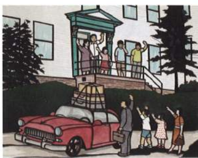
"Moving On" Aki Sogabe, 2015 新しい生活基盤を整え、ハントホテルを離れる家族