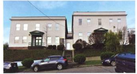
現存するシアトル日本語学校の校舎(2016年撮影)。現在は、ワシントン州日本文化会館(JCCCW)のオフィスとして日系コミュニティの活動拠点のひとつとなっている。

運動自体は成功しましたが、ほろ苦いものでもありました。19世紀後半にアメリカ西海岸に渡り、強制収容によって辛酸を舐めた一世のほとんどが、この時には既にこの世を去っていたのです。最も謝罪を受けるべきであった一世の多くが公式謝罪を見届けることなく亡くなったことはなんとも無念なことでした。