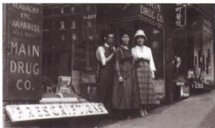
戦前のシアトル日本町

第二次世界大戦が始まると、日系コミュニティのリーダーたちが根拠もなく「日本のスパイ」だと疑われ逮捕されました。シアトル日本語学校でも校長が逮捕され、学校は閉鎖に追い込まれました。