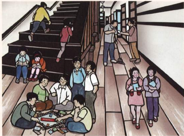
"Hallway Activities" Aki Sogabe, 2015 子どもたちにとっては楽しい遊び場だったハントホテル

企画展では、ハントホテルへの入居から約50年の歳月を経て、元居住者たちが当時暮らした校舎にはじめて集った際のインタビュー映像を上映しています。当時まだ子どもだった元居住者たちの言葉からは、親世代のつましい振る舞いや、ハントホテルで過ごした日々が、質素ながらもわびしいものではなく、楽しい遊び場のようなものでもあったことが伺い知れます。