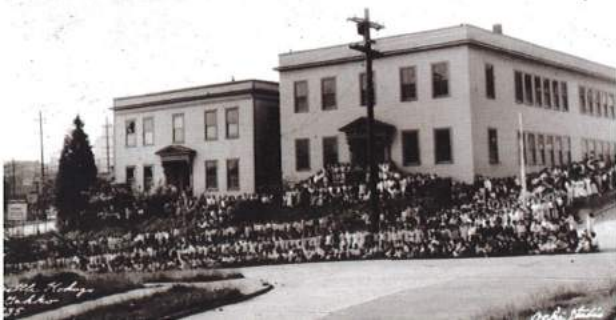
1935年 シアトル日本語学校校舎

現在のシアトル日本語学校の建物は1913年1月に完成し、さらに二つの建物がそれぞれ1917年と1925年に完成しました。後にハントホテルの居住者となる人々の多くは、第二次大戦前にこの日本語学校に通っていた生徒とその家族でした。