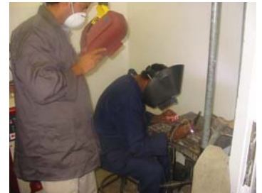
التدريب على لحام الضغط العالي (TIG)

وصل للأردن تسعة عشر مشاركاً من المؤسسة العامة للكهرباء اليمنية خلال شهر تشرين الأول وذلك لحضور أربعة دورات تدريبية يعقدها مركز التدريب الكهربائي التابع لشركة الكهرباء الوطنية، وذلك بتنظيم ومشاركة بين شركة الكهرباء الوطنية وجايكا وهذه الدورات في مجالات: لحام الضغط العالي باستخدام أقطاب التنجستون المحجب بالغاز، وقاية شبكات النقل الكهربائية، وصلات كبلات القوى الكهربائية وصيانة وحدات التوليد/ ديزل. وسيستمر انعقادها لمدة ستة أسابيع.