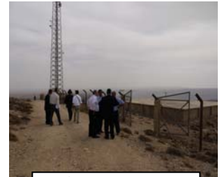
زيارة خزان غرندل/ الطفيلة

هذا و من الجدير ذكره أن المشروع يهدف الى ديمومة تزويد المواطنين بمياه آمنة و ذلك من خلال تطوير و تحسين أنظمة المياه في تلك المناطق. و لتحقيق الهدف سوف يتم انشاء خزانات مياه اضافية، انشاء خطوط نقل و توزيع وتركيب مضخات رفع اضافية لمكلمات شبكات المياه. وفي حال ثبت جدوى المشروع، سوف تقوم جايكا بانجاز المرحلة الثانية من الدراسة و التي تتضمن التصميم الهندسية خلال شهر نيسان 2010.