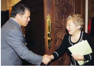
جلالة الملك عبدالله و السيدة أوغاتا

انعكاسا للدور الهام الذي يلعبه الأردن في المنطقة، حرصت رئيسة جايكا السيدة ساداكو أوغاتا خلال زيارتها الى المنطقة على زيارة المملكة، حيث أمضت يومين في زيارة المملكة التي امتدت من 7 حتى 10 تشرين الأول 2009 و قامت بزيارة جلالة الملك عبدالله الثاني وبحثت معه العلاقات الثنائية بين جايكا والأردن، خاصة بعد عملية الدمج مابين جايكا و JBIC و امكانية امتداد المساعدات على نطاق أوسع من جايكا الى الاردن. من جانبه أثنى جلالة الملك عبدالله الثاني على الدعم الذي تقدمه جايكا للمساعدة في تنفيذ مشاريع تنموية واقتصادية في المملكة، على الرغم من التباطؤ الاقتصادي الدولي.