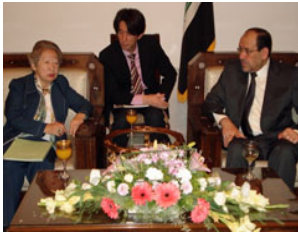
السيدة أوغاتا و رئيس الوزراء نوري المالكي

تعهدت الوكالة اليابانية للتعاون الدولي بتقديم ثلاثة قروض من أجل تمويل ثلاثة مشاريع في جمهورية العراق و بذلك يصل إجمالي المشاريع الممولة من خلال المساعدات التنموية الرسمية المقدمة من قبل الوكالة اليابانية للتعاون الدولي خمسة عشر مشروعا. و تشمل المشاريع الثلاثة الجديدة مشروع إنشاء محطة ديرالوك و مشروع تحسين تزويد المياه في وسط و غرب العراق و مشروع إنشاء محطة عكاظ الغازية.