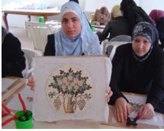
تدريب التوظيف الذاتي - الفسيفساء

بناء على طلب الحكومة الأردنية ممثلة في دائرة الشؤون الفلسطينية (DPA) ، ونظرا للعدد الكبير من أولئك الذين استفادوا من المرحلة الأولى من مشروع تحسين سبل العيش للاجئين الفلسطينيين، قررت الحكومة اليابانية ممثلة بجايكا المشروع من خلال المرحلة الثانية، حيث في يوم 27 أيار 2009 وقع الجانبان على اتفاق المشروع، و الذي سيستمر لمدة ثلاث سنوات.