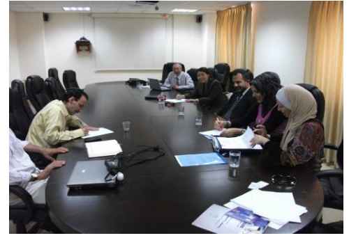
مناقشة بين جايا و سلطة الطاقة الفلسطينية

قام وفد من جايا وشركة الكهرباء الوطنية بزيارة إلى فلسطين خلال الفترة 14-19 تموز، 2012 لعقد مناقشات مع سلطة الطاقة الفلسطينية وبحث التدابير التي يتعين اتخاذها من قبل الأطراف الثلاثة لنجاح تنفيذ برنامج التدريب " لبناء قدرات العاملين في قطاع الكهرباء في فلسطين"