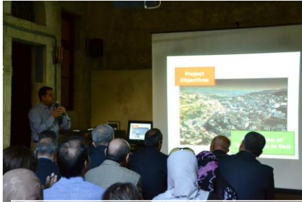
ورشة عمل لعرض المشروع

لقد تم التوقيع على محضر الاجتماعات بين وزارة السياحة والاثار ومكتب جايا بتاريخ 2012 /6/21 حيث تم البدء بالعمل في مشروع " تطوير سياحة مجتمعية مستدامة في مدينة السلط" في شهر ايلول حيث تم ارسال اربعة خبراء يابانيين , خلال فترة تنفيذ المشروع على مدى ثلاثون شهرا سيقوم مكتب جايا بارسال ثمانية خبراء يابانيين و تدريب النظراء الاردنيين في اليابان وتزويد المشروع ببعض الاجهزة الضرورية من اجل تحقيق الاهداف التالية: