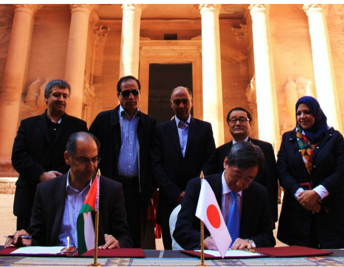
سعادة السفير الياباني يوقع مذكرة التفاهم

من اجل إطالة مدة إقامة السائح مما ينعكس بالفائدة على المجتمع المحلي لوادي موسى فقد قررت الحكومة اليابانية إنشاء متحف محاذ لمركز الزوار في مدينة البتراء الوردية من خلال منحة قيمتها حوالي 6.8 مليون دولار امريكي.