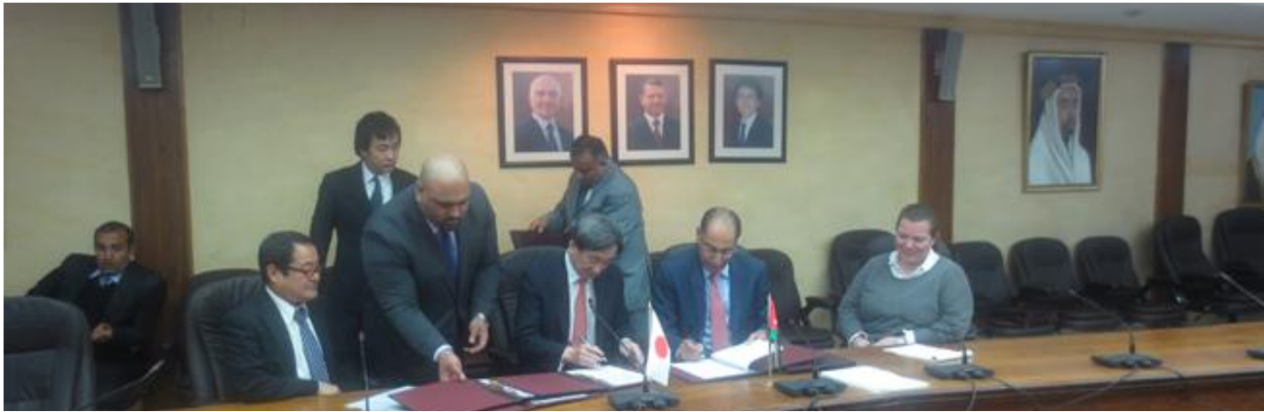
حفل توقيع مذكرة المناقشات و اتفاقية المنحة في وزارة التخطيط والتعاون الدولي

ووفقاً الى ذلك، وقعت سلطة المياه مذكرة المناقشات مع الوكالة اليابانية للتعاون الدولي (جايجا) في التاسع من كانون الثاني 2014 للقيام ببرنامج شامل استجابةً لأحتياجات الطارئة لهذا القطاع، و يهدف هذا البرنامج الى تقييم تأثير "اللاجئين السوريين" على إمدادات المياه وخدمات الصرف الصحي في المجتمعات المحلية المضيفة.