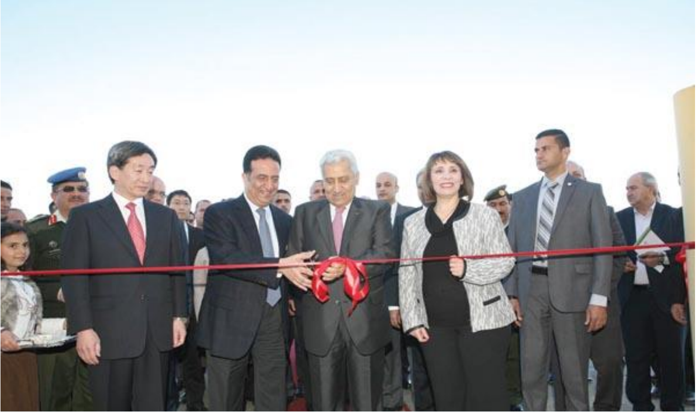
دولة رئيس الوزراء الدكتور عبدالله النسور يفتتح الحفل

تحت رعاية دولة رئيس الوزراء الدكتور عبدالله النسور، اقيم حفل تدشين مشروع تحسين الاجهزة الامنية لمطار الملكة علياء الدولي في العشرين من كانون الثاني لعام 2014 وقد حضر الافتتاح وزير النقل الدكتورة لينا شبيب و وزير الاشغال العامة والاسكان المهندس سامي هلسة و رئيس مجلس ادارة الملكية الاردنية السيد ناصر اللوزي كما حضره السفير الياباني السيد جنيشي كوسيغي وممثل مكتب جابكا الأردن السيد جنجي وكوي.