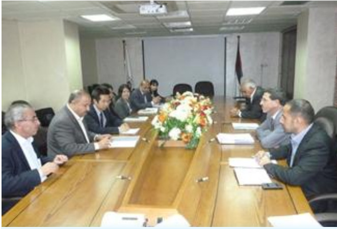
فريق عمل من جايجا وسلطة مياه الأردن يتباحثون المشروع

وُلد التزايد المطرد في عدد اللاجئين السوريين منذ اندلاع الأزمة في اذار 2011 تحد كبير في قطاع المياه بالإضافة العديد من الضغوطات في النظام العام لتوزيع و ضخ المياه و خدمات الصرف الصحي. اكثر من 600 الف لاجيء مسجل متواجدون في القسم الشمالي للمملكة وضعوا المزيد من الضغط على الموارد المائية التي هي محدودة في الأردن. مما تطلب استجابة و دعم المجتمع الدولي.