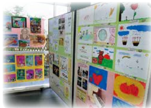
世界の子ども絵画展～ぼく、わたしの好きなもの～