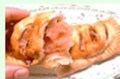
りんごりんご アップルパイ・カレーミートパイ 芋栗パイ等