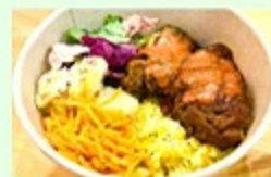
NINA SPICE (ニナスパイス) スタンドリーテキンライス・ポーク ジンジャーライス・アイスチャイ等