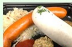
ドイツレストランヴェルツブルク ドイツン・セージ・ドイツのスープ等