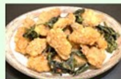
台湾厨房 秋吟 蔥油餅・台湾からあげ(鹹酥雞) 高粱製パイナップルケーキ等