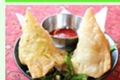
インド料理 RAJU (ラジュ) インドカレー・サムサ・ビリヤニ スタンドリーテキン・チャイ等