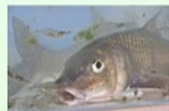
フィッシャーアーキテクト ビワマス塩焼き・ワケギ塩焼き等