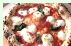
Salice(サリチェ) 窯焼きピザ(赤こん・マルゲリータ等)