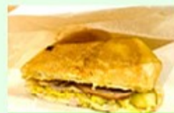
ますたんKitchen キューバサンド・ファミサンド等