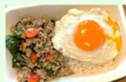
コップンキッチンカー カパオライス・カオマンカイ・ グリーンカレー等