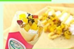
Cafe Cherish (カフェチャリッシュ) クレープ・ソフトドリンク等