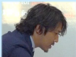
(公財)京都府国際センター 事業課主任

このセミナーは、日本国内で暮らす外国人の方々が、日本の災害について理解を深め、また企業のみならず外国籍従業員も含めた企業防災対策を推進するためのヒントを得ていただく事を目的としています。セミナーを通して災害時の対応方法や、防災の基礎知識を学びましょう。