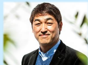
防災プロデューサー NPO法人プラス・アーツ 理事長

コロナ禍で避難所のクラスター化が懸念されるなかで、「在宅避難」の重要性が叫ばれています。その「在宅避難」のために必要不可欠な7つのグッズに関して詳しい解説付きで紹介します。