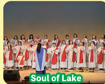
Soul of Lake