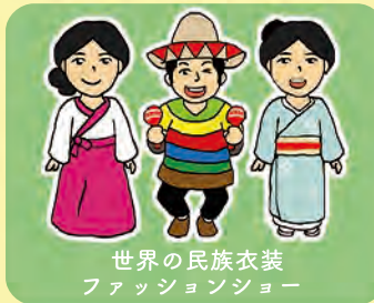
世界の民族衣装 ファッションショー