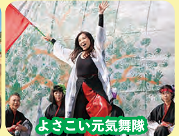
よさこい元氣舞隊