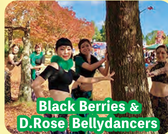
Black Berries & D.Rose Bellydancers