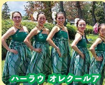
ハーラウ オレクールア