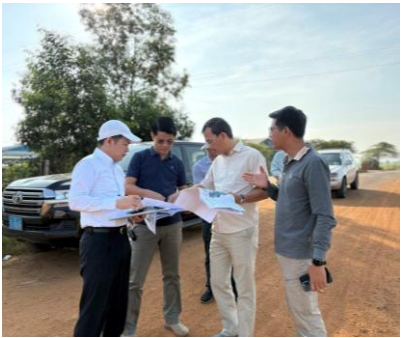
ការពិនិត្យលើទីតាំងគម្រោងរវាងចែក និង ក្រសួងអភិវឌ្ឍន៍ជនបទ

ផ្លូវបេតុង ដែលមានទទឹងសរុប ៨ម៉ែត្រ ដោយទុកផ្លូវ១ម៉ែត្រសងខាង ដើម្បីបង្កើនសុវត្ថិភាព និងឱ្យចរាចរណ៍ធ្វើដំណើរបានល្អ។