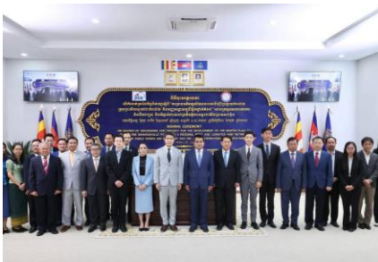
ពិធីចុះហត្ថលេខា

រាជធានីភ្នំពេញ, កាលពីខែកក្កដា ឆ្នាំ២០២៥ រដ្ឋមន្ត្រីនៃក្រសួងសាធារណការ និងដឹកជញ្ជូន បានអញ្ជើញជាគណៈអធិបតីក្នុង ពិធីចុះហត្ថលេខាលើកំណត់ត្រានៃកិច្ចពិភាក្សាស្តីពី គម្រោង អភិវឌ្ឍន៍ផែនការមេ ដើម្បីប្រែក្លាយកំពង់ផែ ក្រុង ព្រះសីហនុទៅជាកំពង់ផែ និងមជ្ឈមណ្ឌល ឡូជីស្ទិកថ្នាក់តំបន់ រវាងក្រសួងសាធារណការ និង ដឹកជញ្ជូន និងទីភ្នាក់ងារសហប្រតិបត្តិការអន្តរ ជាតិដំបូងប្រចាំនៅកម្ពុជា (ចែកា) ដោយមាន ការអញ្ជើញចូលរួមពី ឯកឧត្តម លោកជំទាវ ជា ថ្នាក់ដឹកនាំក្រសួង ប្រតិភូ ចែកា និងមន្ត្រីជំនាញ ពាក់ព័ន្ធ។