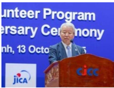
ប្រធាន តាណាកា ផ្តល់សន្ទរកថា

លោក តាណាកា អាគីហ៊ីកុ ប្រធានចែក បានបំពេញទស្សនកិច្ចប្រទេសចំនួន៣គឺ ព្រះរាជាណាចក្រកម្ពុជា សាធារណរដ្ឋប្រជាធិបតេយ្យប្រជាមានិតកម្ពុជា និងព្រះរាជាណាចក្រថៃ ចាប់ពីថ្ងៃទី១១ ដល់ថ្ងៃទី១៨ ខែតុលា ឆ្នាំ២០២៥។ លោកប្រធាន តាណាកា បានចូលរួមពិធីខួបលើកទី៦០ នៃកម្មវិធីអ្នកស្ម័គ្រចិត្តសហប្រតិបត្តិការក្រៅប្រទេសរបស់ចែក កា និងបានពិនិត្យគម្រោងសហប្រតិបត្តិការរបស់ចែក កា ដោយបានបញ្ជាក់ពីលទ្ធផលនៃកិច្ចសហប្រតិបត្តិការរហូតមកទល់ពេលនេះ ក៏ដូចជាបញ្ហាប្រឈម និងទស្សនវិស័យសម្រាប់ការអភិវឌ្ឍនាពេលអនាគត។ កម្មវិធីខួបលើកទី៦០ នៃអ្នកស្ម័គ្រចិត្តសហប្រតិបត្តិការក្រៅប្រទេសរបស់ចែក កា នីមួយៗ របស់ចែកមានដូចជា៖ [កម្ពុជា]