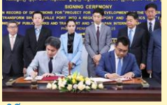
ពិធីចុះហត្ថលេខា