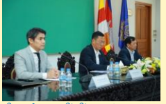
កិច្ចប្រជុំ JCC លើកទី៣របស់គម្រោង