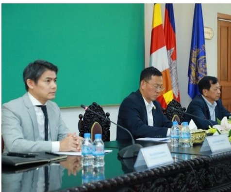
កិច្ចប្រជុំ JCC លើកទី៣របស់គម្រោង

រាជធានីភ្នំពេញ កំពុងជម្រុញផ្តួចផ្តង់និរន្តរ៍យុទ្ធសាស្ត្រមួយដែលទទួលបានការគាំទ្រពី ទីភ្នាក់ងារសហប្រតិបត្តិការអន្តរជាតិជប៉ុន (JICA) ដើម្បីពង្រឹងសមត្ថភាពសម្រាប់ការរៀបចំផែនការ និងការគ្រប់គ្រងការដឹកជញ្ជូនក្នុងទីក្រុងដ៏ទូលំទូលាយ។ គម្រោងនេះលើកកម្ពស់ការអភិវឌ្ឍប្រព័ន្ធដឹកជញ្ជូនដែលគាំទ្រដល់បរិស្ថានទីក្រុងប្រកបដោយចីរភាព និងឆ្លើយតបទៅនឹងតម្រូវការធ្វើដំណើរដែលកំពុងផ្លាស់ប្តូររបស់ទីក្រុង។