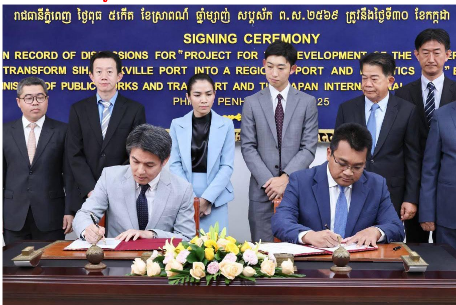
ពិធីចុះហត្ថលេខាលើកំណត់ត្រានៃកិច្ចពិភាក្សាស្តីពីគម្រោង

ការអភិវឌ្ឍន៍ផែនការមេដើម្បីប្រែក្លាយកំពង់ផែក្រុងព្រះសីហនុទៅជា កំពង់ផែ និងមជ្ឈមណ្ឌលឡូជីស្ទិកថ្នាក់តំបន់