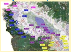
ទីតាំងរបស់គម្រោង